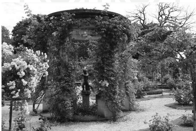
III. 5. "Temple de l' Amour" Rose garden, l'Hay-les-Roses