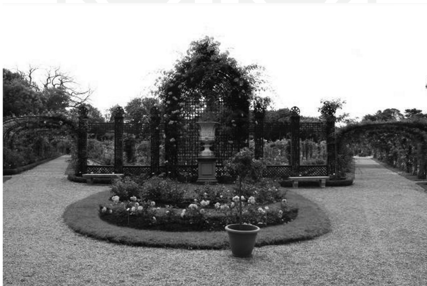
III. 2. Rose garden, l'Hay-les-Roses

At present the rosarium occupies an area of 1.7 ha, where 35,000 roses of 3,300 varieties are exhibited, including 185 botanical varieties. Box borders run along a total length of 5 km, garden furniture, such as pergolas and trellises which additionally show the diversity of forms of rose shrubs and numerous sculptures and fountains are important compositional elements. Today the rosarium exhibits roses in 13 theme sectors, 12 of which were preserved from the 1910 design. The 13 th sector was introduced for future generations as a parcel exhibiting current rose growing achievements. It is particularly important for future generations for whom current rose growing novelties will be another stage in the history of the rose. The main task of the rosarium is to make a chronological presentation of the evolution of the rose, from old to current species.