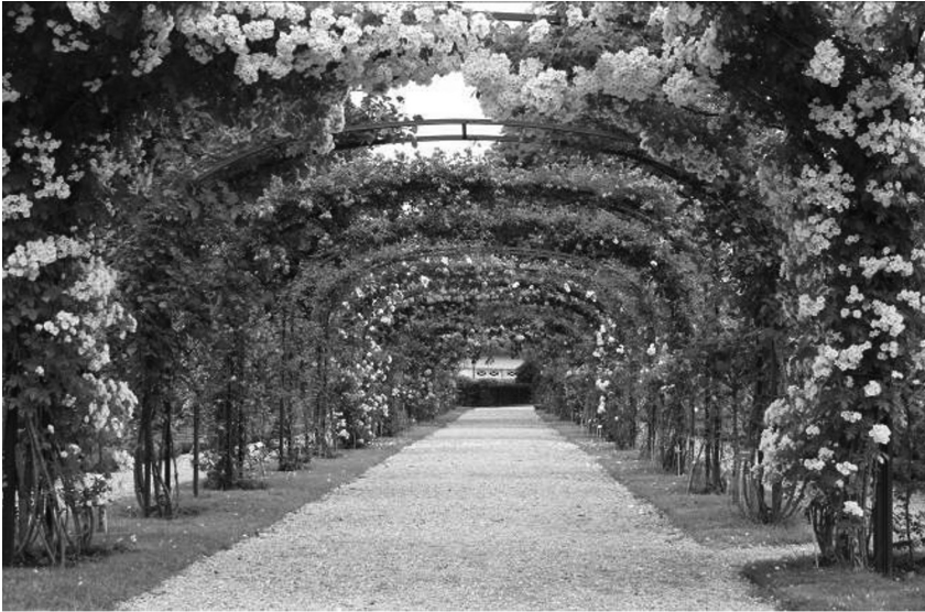
III. 3. Rose garden, l'Hay-les-Roses