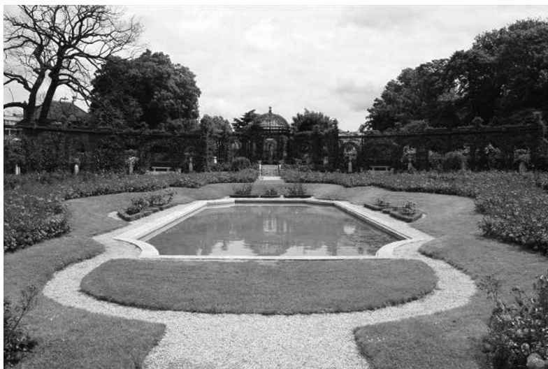
III. 4. Pond in Rose garden, l'Hay-les-Roses