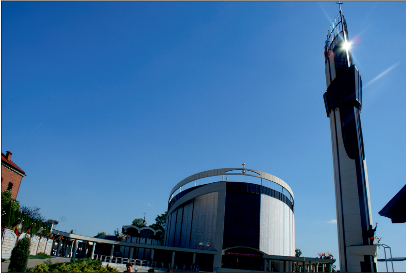
Fot. 1. Bazylika Miłosierdzia Bożego i wieża widokowa w łąkiwnickim sanktuarium