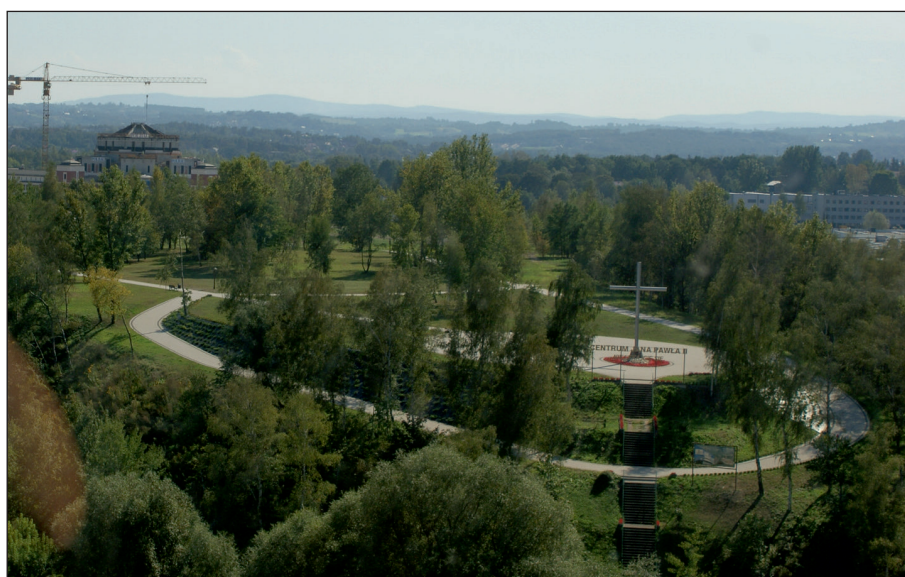
Fot. 4. Centrum Jana Pawła II – krzyż wzniesiony na kamieniach przyniesionych przez młodzież na krakowskie Błonia podczas pielgrzymki papieża Benedykta XVI w 2006 r.