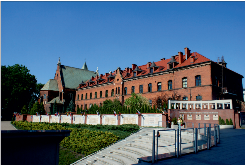
Fot. 2. Klasztor Zgromadzenia Sióstr Miłosierdzia Bożego, stara część łąkiwnickiego sanktuarium