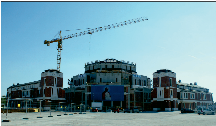
Fot. 3. Centrum Jana Pawła II „Nie lękajcie się” w trakcie budowy, wrzesień 2012 r.