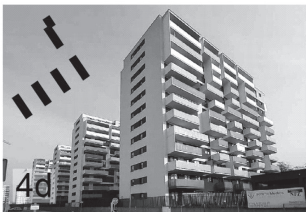
il. 4. Omówione przykłady zespołów zabudowy wraz z miniaturami prezentującymi ich plan – rysunki wykonane z zachowaniem jednakowej skali. 4a: ul. Bochenka 14–14a; 4b: ul. Bochenka 20–24; 4c: ul. Bochenka 25–25d; 4d: ul. Bochenka 12a–12e. ill. 4. The examples of building complexes under discussion with thumbnails presenting their plan-drawings made at the same scale. 4a: 14–14a Bochenka Street; 4b: 20–24 Bochenka Street; 4c: 25–25d Bochenka Street; 4d: 12a–12e Bochenka Street.

prostopadłościennych budynków o 9, 10 i 11 kondygnacjach z garażami podziemnymi. Obiektom towarzyszy niewielki teren zielony z placem zabaw. Podobnie jak wcześniej opisane przykłady z ul. Bochenka, również ta inwestycja jest kompleksem grodzonym. Forma architektoniczna jest prosta i uporządkowana. Beżowe płaszczyzny ścian zostały ożywione pasami szarego tynku oraz szarymi balkonami. Akcent stanowią czerwone ścianki działowe balkonów. Budynki posiadają dachy płaskie. W obiektach nie umieszczono lokali usługowych.