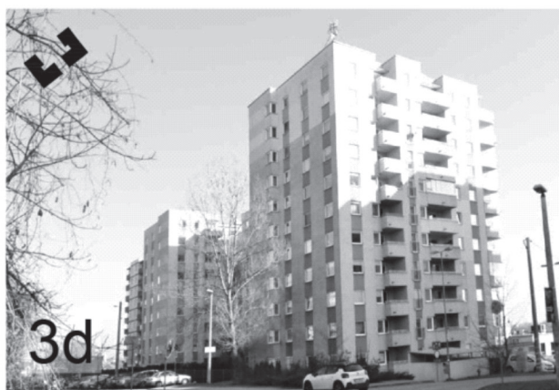
il. 3. Omówione przykłady zespołów zabudowy wraz z miniaturami prezentującymi ich plan – rysunki wykonane z zachowaniem jednakowej skali. 3a: ul. Halszki 28–28a; 3b: ul. Kordiana 31–35; 3c: ul. Turniejowa 59a–59c; 3d: ul. Bochenka 16–18. ill. 3. The examples of building complexes under discussion with thumbnails presenting their plan-drawings drawn to the same scale. 3a: 28–28a Halszki Street; 3b: 31–35 Kordiana Street; 3c: 59a–59c Turniejowa Street; 3d: 16–18 Bochenka Street.

tów posiadają rzut na planie litery U, trzeci zbudowany jest w oparciu o kształt prostokąta. Dachy wykonano jako stropodachy płaskie. Pod obiektami zlokalizowano garaże podziemne. Forma architektoniczna budynków ukształtowana jest przez dowolnie rozmieszczone w obrębie elewacji płaszczyzny tynku szarego i intensywnie pomarańczowego. Powierzchnie kolorowe są uzupełnione szklanymi i stalowymi częściami balkonów. Duża liczba elementów powoduje, że bryła sprawia wrażenie silnie rozrzeźbionej. Zespół obiektów jest całkowicie wyodrębniony, w parterach nie umieszczono lokali usługowych.