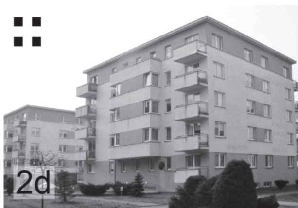
il. 2. Omówione przykłady zespołów zabudowy wraz z miniaturami prezentującymi ich plan – rysunki wykonane z zachowaniem jednakowej skali. 2a : ul. Turniejowa 70; 2b : ul. Tuchowska 2–4c; 2c : ul. Turniejowa 73–73e; 2d : ul. Wystouchów 1–3a. ill. 2. The examples of building complexes under study with thumbnails presenting their plan-drawings drawn to the same scale. 2a : 70 Turniejowa Street; 2b : 2–4c Tuchowska Street; 2c : 73–73e Turniejowa Street; 2d : 1–3a Wystouchów Street.

(proj. Michał Szymanowski) (Motak, 2007, s.154) (il. 2a). Czterokondygnacyjny blok z garażami podziemnymi, został uformowany na planie zbliżonym do trójkąta. Jego wnętrze pozostało niezabudowane, tworząc dziedziniec niedostępny dla postronnych osób. Architektura założenia posiada cechy postmodernizmu takie, jak silnie zaznaczone wejście przypominające wieżę bramną oraz zastosowane kolory – błękit i róż, które delikatnie podkreślają poszczególne elementy budynku. Obiekt został przekryty łupinowym dachem. Budynek dzięki charakterystycznemu kształtowi oraz zastosowanym środkom ma spójną i konsekwentną formę.