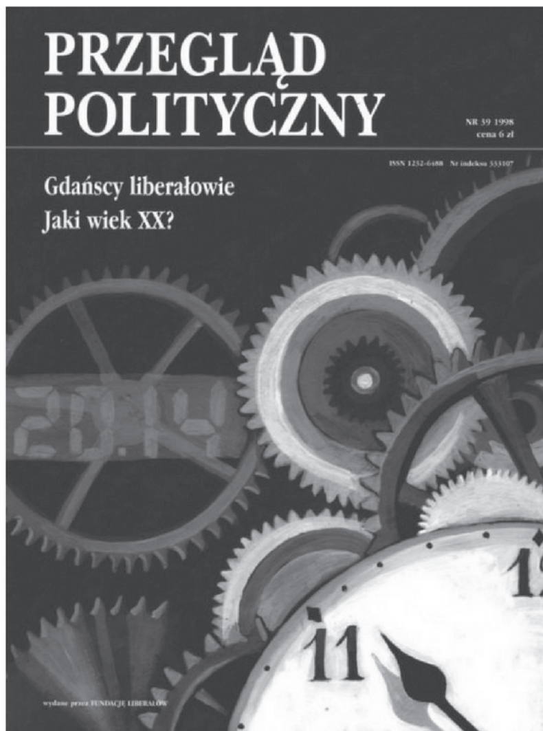
Rycina 3. Okładka „Przeeglądu Politycznego”, nr 39 z 1998 roku

Aby uzyskać dotację z różnego rodzaju funduszy czy instytucji, redakcja wykonywała projekt, scenariusz numeru, a następnie szukała podmiotu, który wsparłby finansowo jego realizację. Dzięki zaangażowaniu w tematy lokalne zdobyła środki od Sejmiku Samorządowego ówczesnego Województwa Gdańskiego za pomoc w wydaniu numeru 29 z jesieni 1995 roku (Temat numeru brzmiał: Bunt prowincji. Był sobie Gdańsk.). Ponownie od władz lokalnych redakcja pozyskała fundusze do realizacji numerów 44 i 45 (2000). Były to środki od urzędu marszałkowskiego oraz od samorządu województwa pomorskiego.