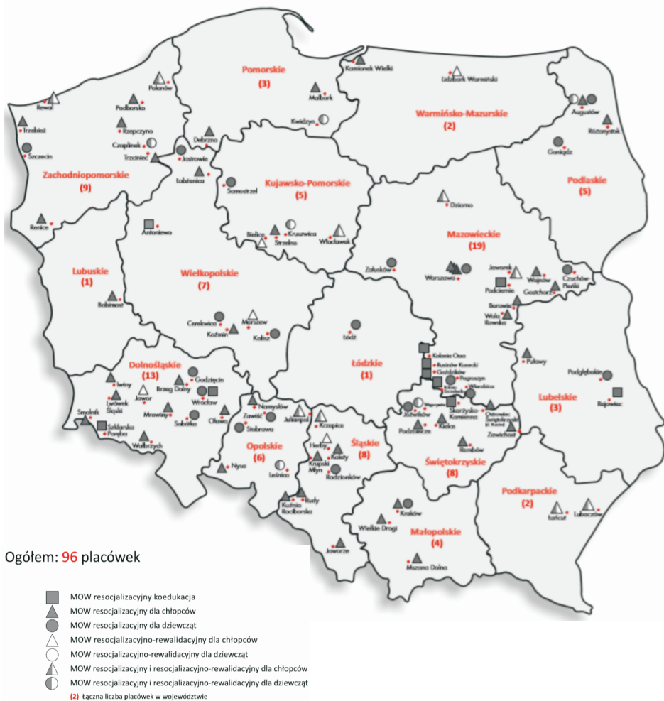
Rysunek 1. Rozmieszczenie młodzieżowych ośrodków wychowawczych na terenie Polski

Funkcjonowanie młodzieżowych ośrodków wychowawczych oraz młodzieżowych ośrodków socjoterapii reguluje ustawa z dnia 7 września 1991 r. o systemie oświaty. Zgodnie z rozporządzeniem Ministra Edukacji Narodowej z dnia