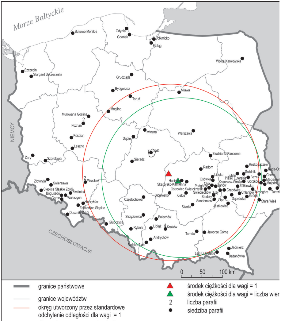
Ryc. 3. Rozmieszczenie parafii Polskiego Narodowego Kościoła Katolickiego w 1965 r.

Źródło: opracowanie własne na podstawie Białeckiej (2003).