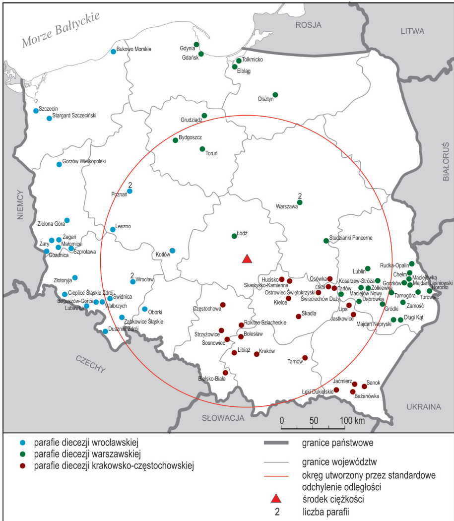
Ryc. 4. Rozmieszczenie parafii Kościoła Polskokatolickiego w 2012 r.