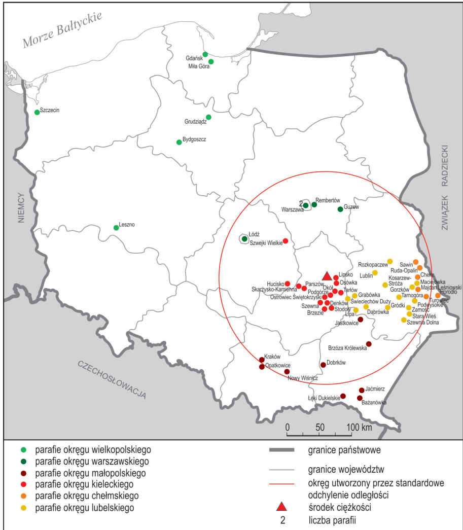
Ryc. 2. Rozmieszczenie parafii Polskiego Narodowego Kościoła Katolickiego w 1945 r.