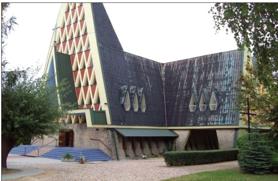
Ryc. 5. Kościół polskokatolicki w Kotłowie

(21,3%), 45–59 lat (26,0%) oraz 60 i więcej lat (24,7%). Zdecydowana większość ankietowanych (76,7%) знаła źródło konfliktu i historię wyodrębnienia się parafii polskokatolickiej, choć w przedziale najmłodszych respondentów (18–29 lat) poziom ten był wyraźnie niższy (62,9%). Również większość parafian (64,7%) orientowała się jak jest przybliżona wielkość parafii, wskazując przedział 1000–2000 wiernych; jednakże 27,3% ankietowanych zaniżyło wielkość ich społeczności wyznaniowej. Z kolei na pytanie otwarte dotyczące napięć międzywyznaniowych w społeczności wiejskiej Kotłowa tylko połowa respondentów udzieliła odpowiedzi, wskazując dwie płaszczyzny napięć: