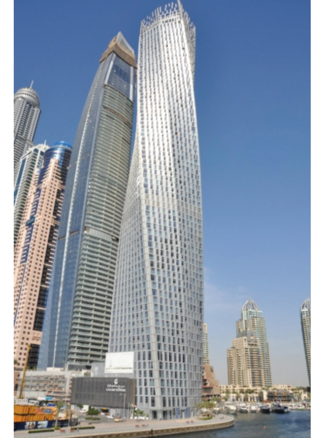
III. 4, 5. Views of Cayan Tower displaying its spiral shape, amidst the landscape of Dubai Marina

okiennych, co zapobiega zjawisku przegrzewania się wnętrza budynku. Inteligentny system zarządzania analizuje temperaturę pomieszczeń i samoczynnie optymalizuje ją, gdy przekroczy rekomendowane 23°C. Zastosowano inteligentny system wymiany powietrza, gdy temperatura wewnątrz pomieszczenia będzie większa niż 23° C. Dostarczane do pomieszczeń powietrze przechodzi proces obróbki termicznej poprzez schładzanie i filtrację. Dzięki temu inteligentne rozwiązania systemowe, zarządzające instalacjami budynku podnoszą komfort użytkownika poszczególnych stref użytkowych budynku. Zastosowany inteligentny system recyklingu wody polegający na oczyszczaniu zużytej wody, pozwala ponownie wykorzystać ją w celach bytowych. Podobnie dzieje się z wodą opadową, która podczas rzadko występujących przecieży w tym rejonie geograficznym opadów, jest gromadzona w postaci szarej wody i poddawana oczyszczaniu przy użyciu inteligentnej technologii oczyszczania. Dzięki temu woda ponownie wykorzystywana jest w celach bytowych, służy też do pielęgnacji zieleni. Inteligentny system zarządzania zasobami pozwala optymalizować potrzeby ludzkie i w znaczny sposób podnosi komfort życia w tym środowisku.