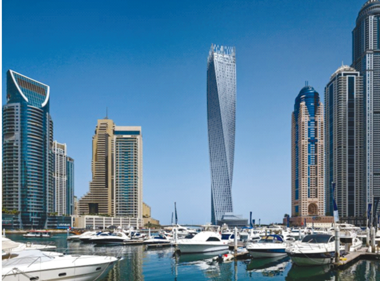
Il. 1. Widok z ekskluzywnej dzielnicy Dubaj Marina na budynek Cayan Tower w Dubaju, wg https://jedenraz.wordpress.com/2016/04/17/cayan-tower-pomnik-racjonalnego-myslenia-w-sluzbie-sztuki-i-handlu/ , dostęp: 20.08.2018 Ill. 1. A view on the Cayan Tower building from the luxury Dubai Marina quarter. (After https://jedenraz.wordpress.com/2016/04/17/cayan-tower-pomnik-racjonalnego-myslenia-w-sluzbie-sztuki-i-handlu/ , access: 20.08.2018)

ding, wyznaczającej nowe kanony dla obowiązujących standardów w projektowaniu oraz użytkowaniu przestrzeni mieszkalnej obejmującej zróżnicowane potrzeby.