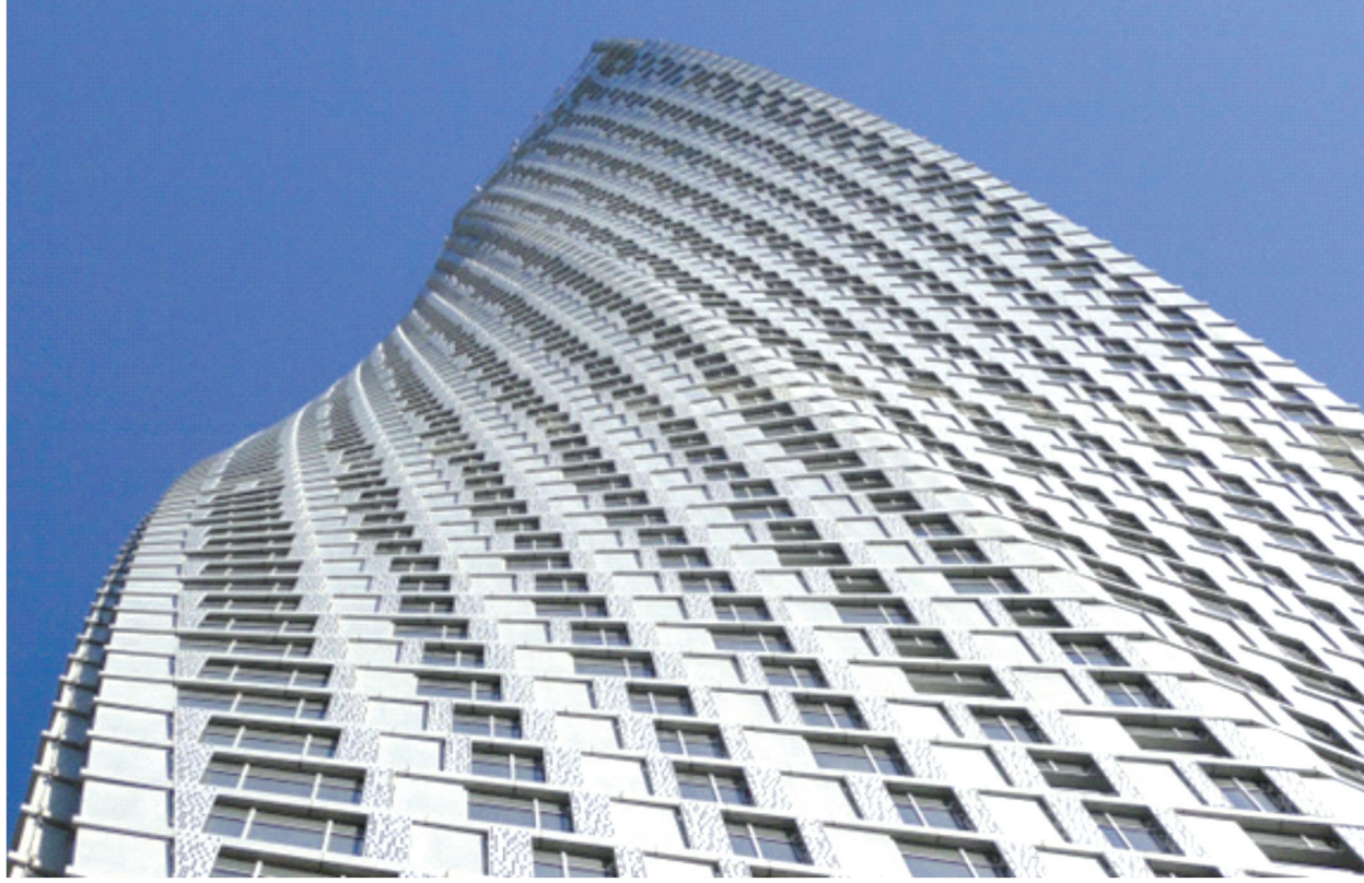
II. 3. Widok pokazujący skrzywienie elewacji budynku Cayan Tower w Dubaju, wg https://jedenraz.wordpress.com/2016/04/17/cayan-tower-pomnik-racjonalnego-myslenia-w-sluzbie-sztuki-i-handlu/ , dostęp: 20.08.2018