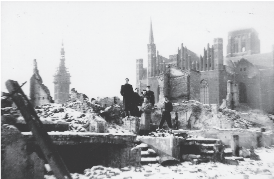
Bild 5. Fragment der Stadtrümmer in 1950 – Rathausurm im Wiederaufbau

Durch einen Zufall stieß der Verfasser dieses Beitrags – der in den Geschichtswissenschaften doch nur ein Amateur ist – auf das Buch 11 , das den gleichen Haupttitel trägt als der (in deutscher Übersetzung) von B. Zwarras Buch. Es erhob sich das Problem ob beide Schriftsteller, offenbar gleicher Generation, über sich gegenüber wussten, sowie – welches Buch früher entstanden ist. Es ist klar, dass beide Bücher von zwei Danzigern geschrieben worden sind – einen Polen (auf polnisch) und einen Deutschen (auf deutsch). Es wäre interessant beide Bücher gegeneinander ausführlich zu vergleichen – auch wenn man annehmen muss, dass die Standpunkte beider Schriftsteller gegenseitig entfernt sind. Nach einer groben Analyse kam der Verfasser zur Einsicht, dass hier vieles unsicher ist und in einer Dämmerung verbleibt; darum wurde „Zwielicht“ zur Überschrift dieses Kapitels. Dazu müsste man künftig breitere Untersuchungen unternehmen.