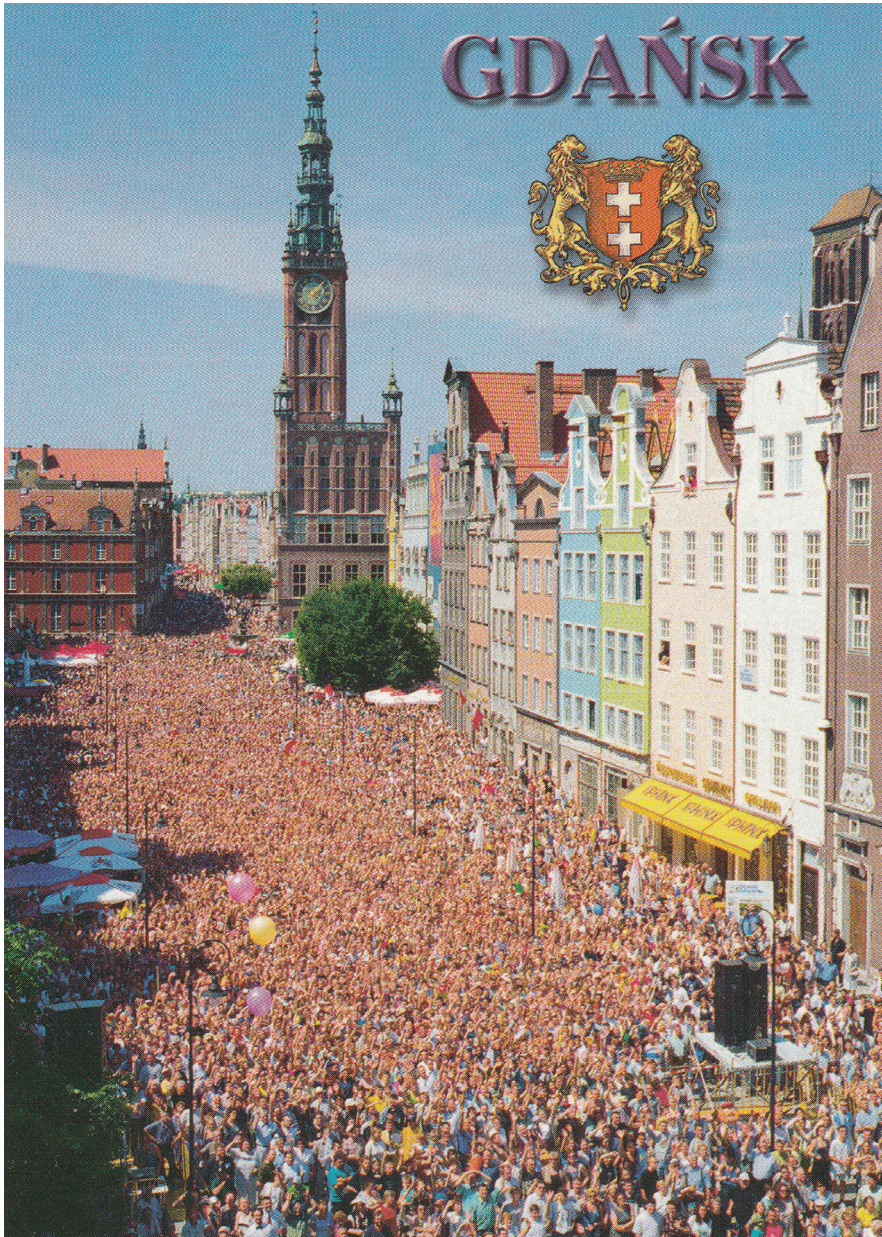
Bild 6. Festversammlung der Bürger von Gdańsk zu 1000 Jahren des Stadtbestehens: Długi Targ (Langer Markt) 1997