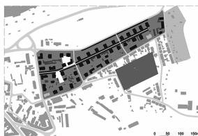
Piaskowa Colony, known as Zandka 1907–1922.