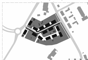
Housing located between the streets: Makoszowska and 3-go Maja, ca. 1905.