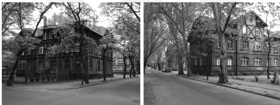
III. 3. Historical buildings and greenery in the Zandka neighbourhood

Agglomeration built based on an architectural project, which was an example of a breakthrough approach towards establishing industrial districts 12 . The residential complex consisted of two-storey detached buildings designed for 12 families each. A characteristic feature of these buildings was the unified nature of the blocks with simultaneous diversification of details, including roof solutions and decorations of façades. The establishment fits in with the stylistic trends of the epoch from the turn of the 20 th century as an example of buildings with elements of secession and solutions characteristic of the English "Arts&Crafts" tradition, including a "Landhaus" type suburban villa 13 . The high value of the neighbourhood was also influenced by attractive surroundings, including the buildings in the Plac Hutniczy and the steelworks park with a villa building designed for the director of the factory. The attractiveness of the architecture and the landscape value of the surrounding areas made Kolonia Piaskowa, at the time of its establishment, one of the most unique establishments in Silesia and the unusually high standard of residential buildings evoked both admiration and controversy 14 .