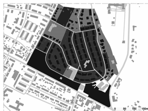
Workers' Colony „Stara Rokitnica” 1905–1930.