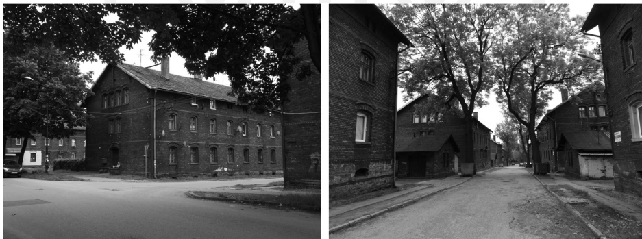
III. 2. Borsig neighbourhoods – current state of preservation

One of the oldest neighbourhoods in the area of the city built with utilitarian aspects as well as landscape values was the Borsig colony located in the Biskupice district near an extensive industrial factory. In the northern part of the establishment there were buildings for clerks and higher ranking employees, standing out among other buildings with more diverse façade decorations. On the southern side there were buildings for workers designed for 8 and 12 families. The accommodation was built from red brick and maintained in the style of historicism. Surrounding the whole complex there were service buildings and green areas 10 . The whole construction created a clear urban composition. Compared with the 19 th -century landscape of Zabrze, which was characterized by randomly located buildings with no aesthetic value, the value of the complex acquires special importance 11 .