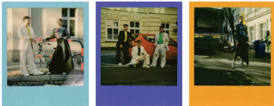
Rysunek 3. Sesja kolekcji Amager z użyciem aparatu Polaroid

zostały w ramach konta @michalwojciak dołączone do tzw. przypiętych relacji pod nazwą #openstudio [Instagram 2021]. W realizowanych materiałach zamieszczałem wymaganą przez organizatora informację o współfinansowaniu projektu ze środków Gminy Miejskiej Kraków w ramach programu Stypendia Twórcze Miasta Krakowa .