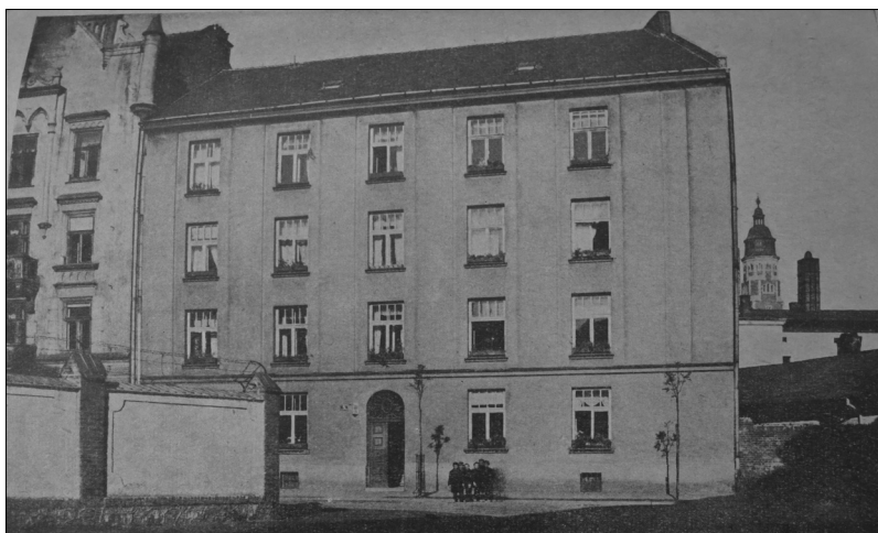
Fot. 1. Zdjęcie domu przy ulicy Sołtyka 4 opublikowane w broszurze o Władysławie Habichtównie.