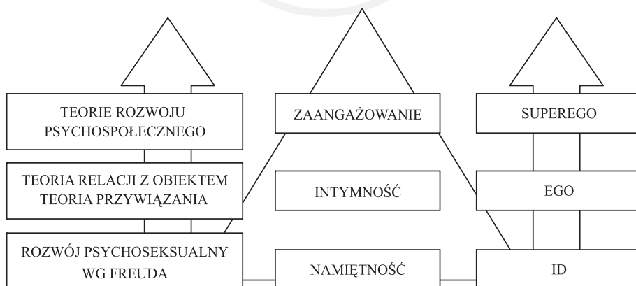
Rysunek 2. Trójwarstwowe ujęcie miłości, teorie psychodynamiczne odnoszące się do poszczególnych warstw oraz instancje psychiczne wyrażające się w danym aspekcie miłości

W okresie wczesnego dzieciństwa, co podkreśla w szczególności teoria relacji z obiektem, dziecko nie tylko poszukuje bliskości,