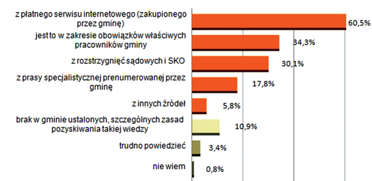
il. 1. Rozkład procentowy odpowiedzi na pytanie o podstawowe źródło pozyskiwanej przez samorzady wiedzy (opracowanie własne) ill. 1. Percentage distribution of answers to the question about the primary source of knowledge obtained by local governments (original work)

Skąd władze gminy czerpią wiedzę o wprowadzanych w życie nowych aktach prawa i sposobach ich interpretacji?