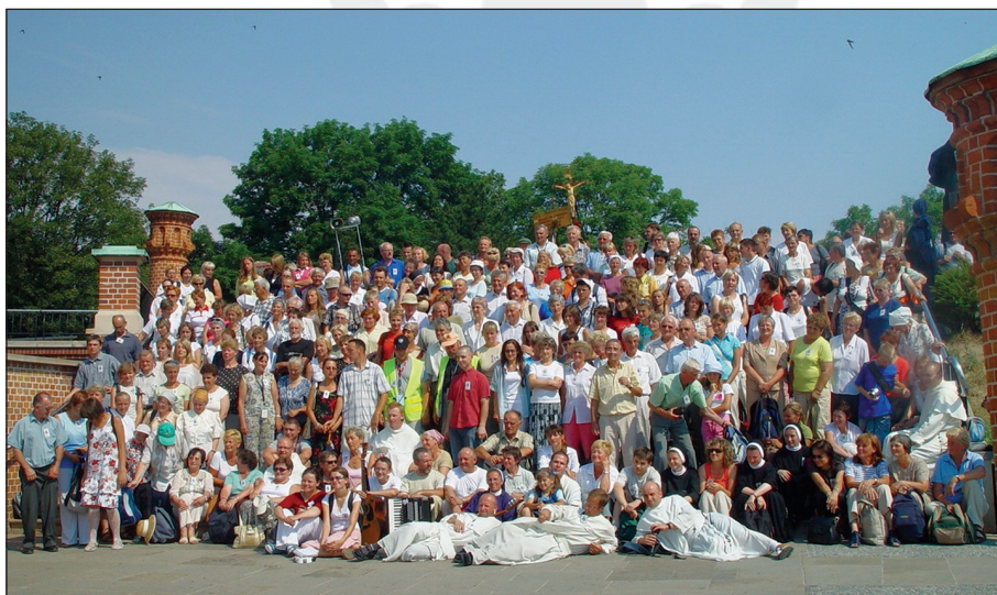
Fot. 1. Uczestnicy XXX Pieszego Pielgrzymstwa Skalecznego na Jasnej Górze (21.07.2006,)