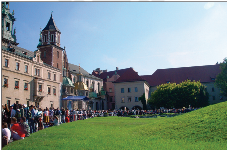
Fot. 2. Uczestnicy XXVIII Pieszej Pielgrzymki Krakowskiej zgromadzeni na Wawelu na mszy świętej inauguracyjnej pielgrzymowania (06.08.2008,)

Sytuacja społeczno-polityczna, w jakiej kształtowała się ta pielgrzymka, bez wątplenia zdeterminowała jej charakter. W kilka lat liczba jej uczestników znacznie wzrosła, z pięciu grup skupiających niecałe 2 tys. pielgrzymów do wielotysięcznej i wielonarodowościowej pielgrzymki, złożonej z ośmiu wspólnot. W 2012 r. liczba