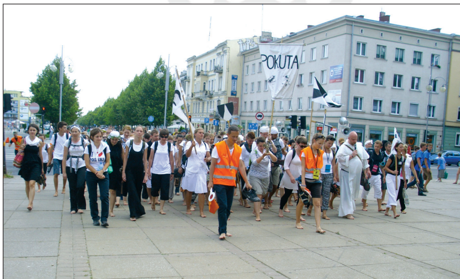
Fot. 3. Uczestnicy XXII Pieszej Pielgrzymki Dominikańskiej z grupy Pokuta pielgrzymujący na Jasną Górę Aleją NMP w Częstochowie (09.08.2013,)

pozycję (ryc. 2). W 2011 r. powołano do życia grupę Rodzinną , dla osób, które pragną przemierzać trasę całymi rodzinami z dorosłymi lub małymi dziećmi. W 2012 r. pielgrzymkę tworzyły następujące grupy: Dziewiętnastka , grupy duszpasterstwa akademickiego: B1 , B2 , cieszące się dużą popularnością: Cisza 1 i Cisza 2 , wspomniana grupa Rodzinną oraz nowopowstałe grupy Żaki (jako kontynuacja grupy Międzymiastowej GPS ) i grupa Pokutna (www 1; www 9; por. www 7) (fot. 3). Ostatnią zmianą wprowadzoną w 2013 r. jest zgromadzenie członków dominikańskich duszpasterstw akademickich, pochodzących z kilku miast Polski w grupie B3 , która istniała jeszcze w 2011 r. Trzecia grupa „Beczki” zajęła miejsce wspomnianej wspólnoty – Żaki 34 .