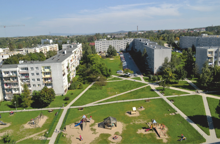
Il. 1. Zielona przestrzeń biegnąca przez osiedle Barwinek / Green area of the Barwinek housing estate

rowanych terenów zielonych, które przy odpowiednim podejściu mogłyby stać się elementem wyróżniającym je spośród współczesnych zespołów.