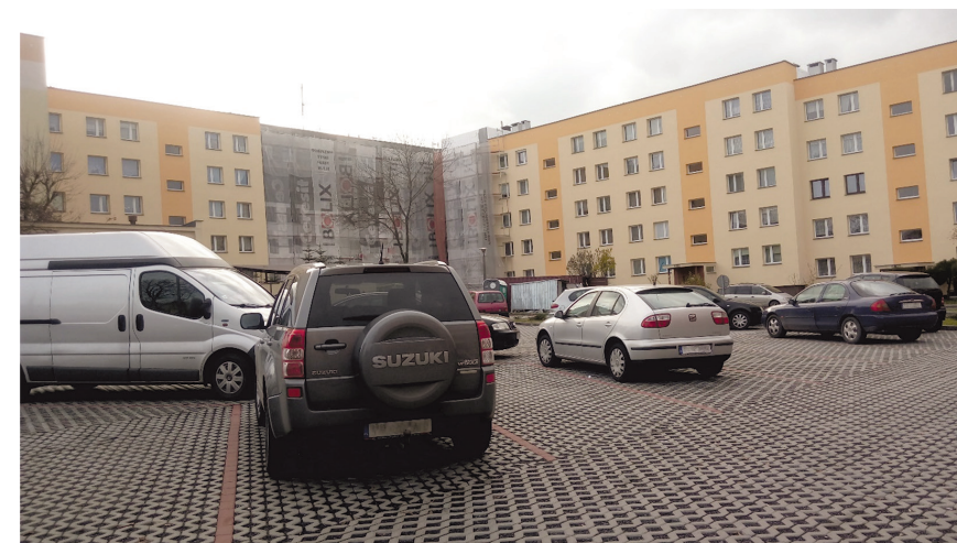
Il. 6. Strefa wejściowa do budynku. Osiedle Pod Dalnią / Entrance area to the building. Pod Dalnia housing estate.