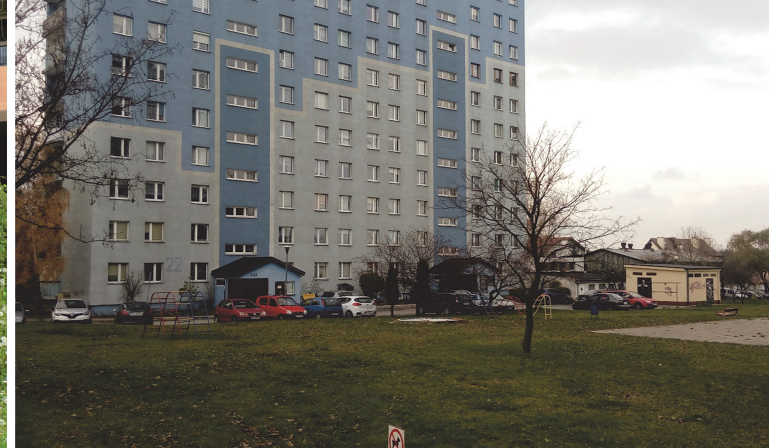
Il. 4. Parkingi w sąsiedztwie placów zabaw. Osiedle Barwinek / Parking lots adjacent to playgrounds. Barwinek housing estate.

Zauważalnym jest zjawisko parkowania pojazdów we wnętrzach między budynkami, na osiedlowych sieciach ulicznych, jak i w przestrzeniach zielonych. Zjawisko to jest powodem dyskomfortu, powoduje hałas, zanieczyszczenie powietrza i stanowi niebezpieczeństwo w przestrzeniach, które powinny służyć rekreacji, np. przy placach zabaw. (il. 4) Źle rozwiązana infrastruktura komunikacyjna znacząco wpływa na jakość codziennego życia mieszkańców, obniża walory użytkowe osiedla i stanowi zagrożenie.