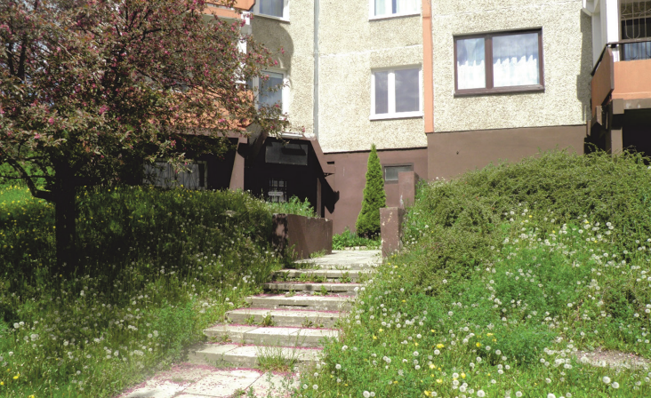
Il. 3. Schody terenowe. Osiedle Pod Dalnią / Terrain stairs. Pod Dalnia housing estate