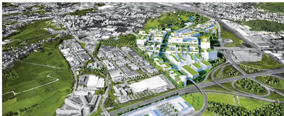
Il. 4. Nowa dzielnica miasta Luksemburg – Clôche d'Or. New district of the city Luxembourg – Clôche d'Or