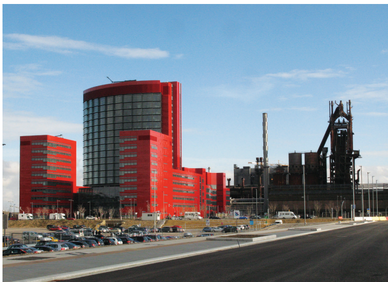
Il. 2. Współczesny landmark dzielnicy Nowe Belval – biurowiec Dexia Belval. Present-day landmark of the new district New Belval – an office building Dexia Belval