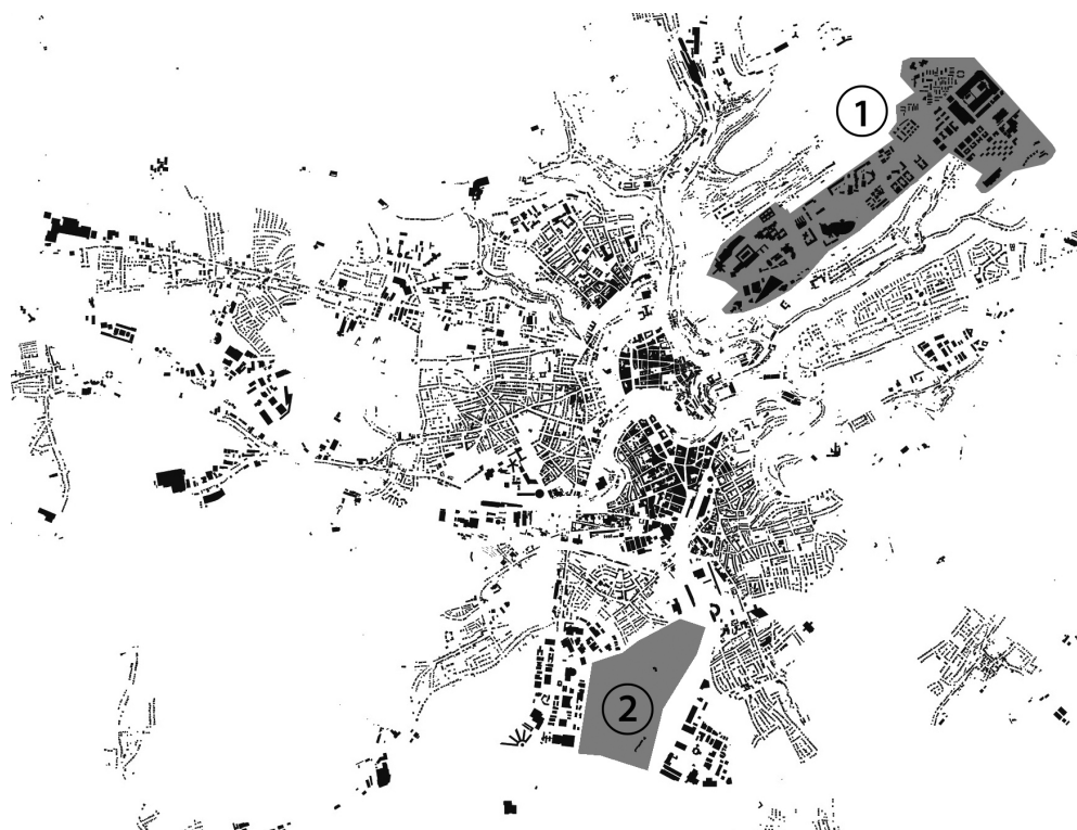
Il. 5. Shwarzplan miasta Luksemburg: 1 – dzielnica Kirchberg, 2 – obszar realizacji dzielnicy Clôche d’Or. Shwarzplan of the city Luxembourg: 1 – Kirchberg district, 2 – an area of Clôche d’Or district (grafika: M. Dudek)