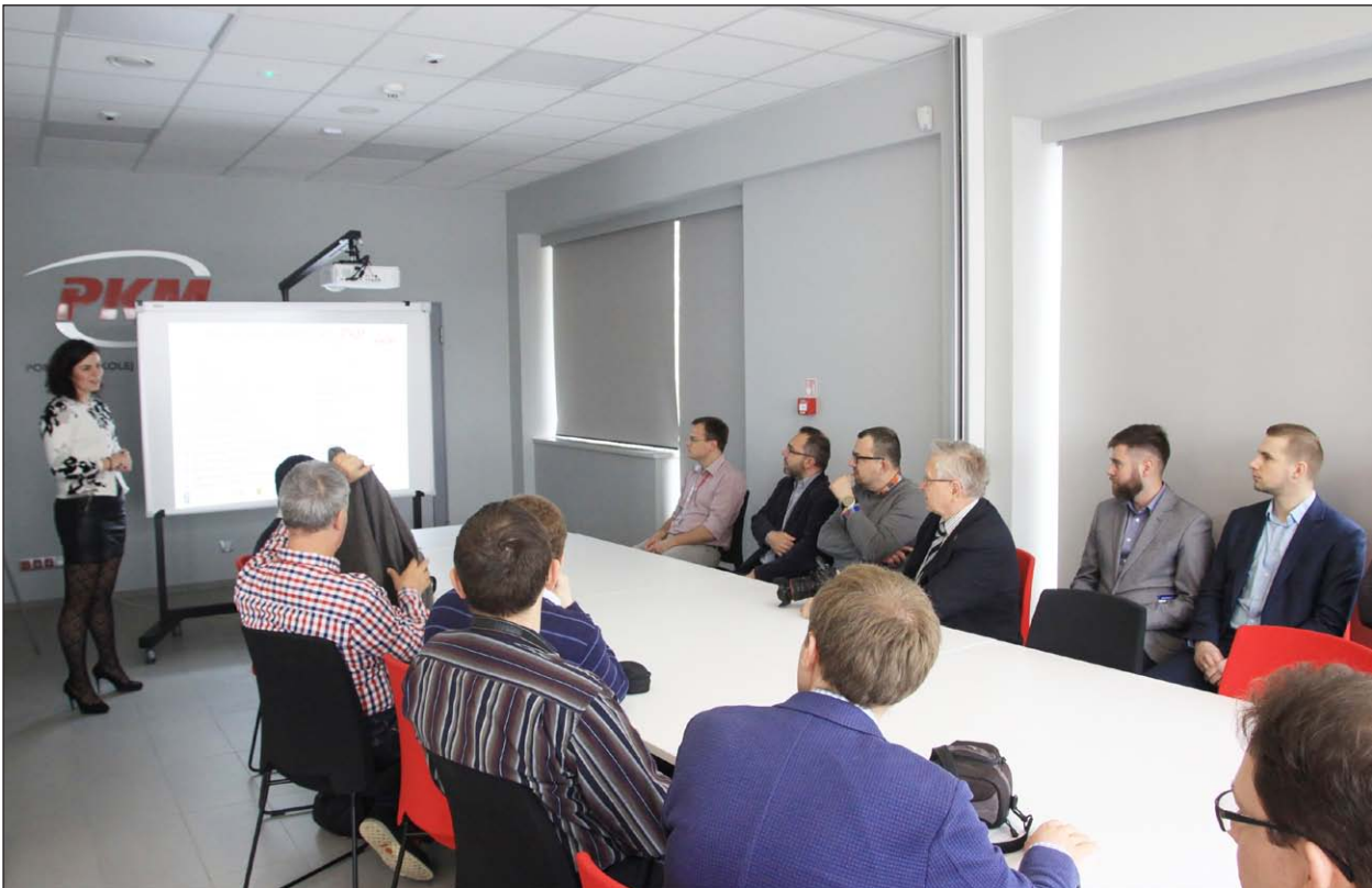
Ryc. 3. Prezentacja funkcjonowania Pomorskiej Kolei Metropolitalnej w Gdańsku przez pracowników PKM S.A. w siedzibie spółki (7.04.2017)