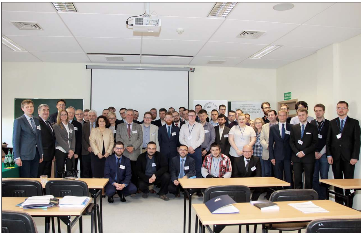
Ryc. 1. Zdjęcie grupowe większości uczestników II Międzynarodowej Konferencji Naukowej pt. „Problemy i wyzwania geografii komunikacji” w Gdańsku (6.04.2017)