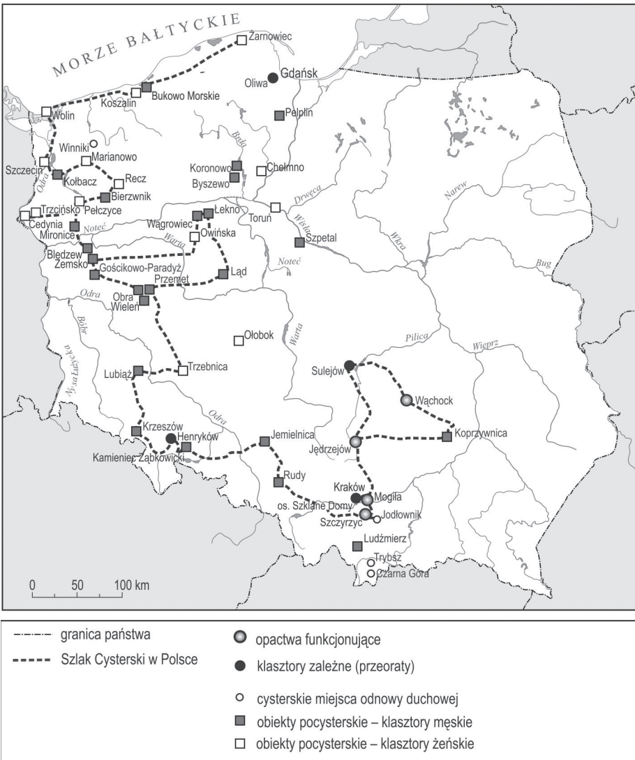
Ryc. 1. Obiekty cysterskie i pocysterskie w Polsce