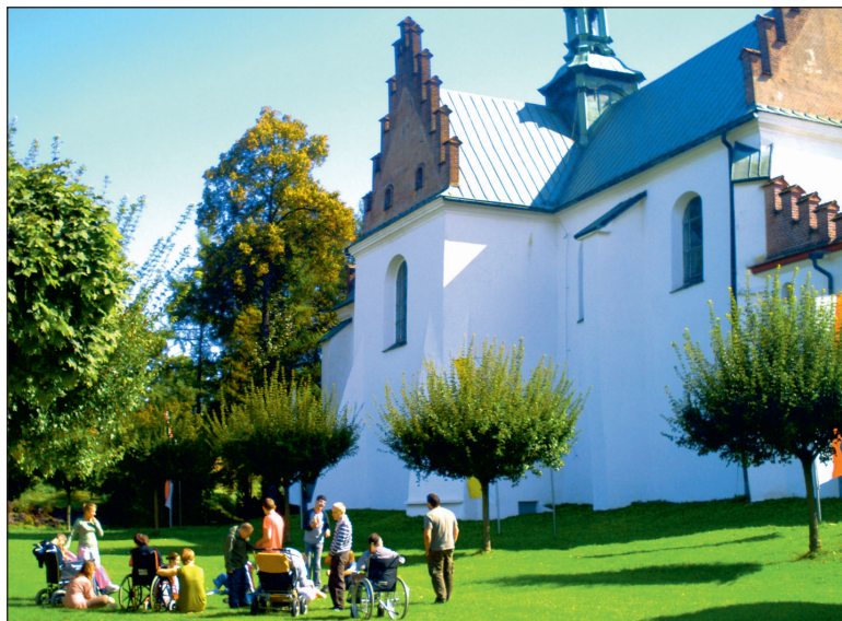
Fot. 4. Pielgrzymi w opactwie cysterskim w Szczyrzycu