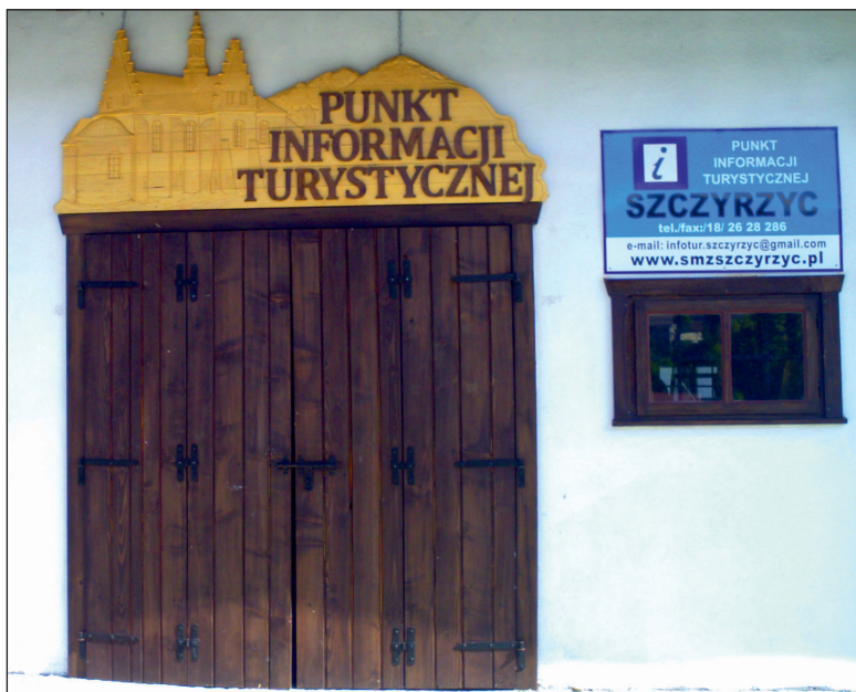
Fot. 3 Punkt Informacji Turystycznej przy opactwie w Szczyrzycu