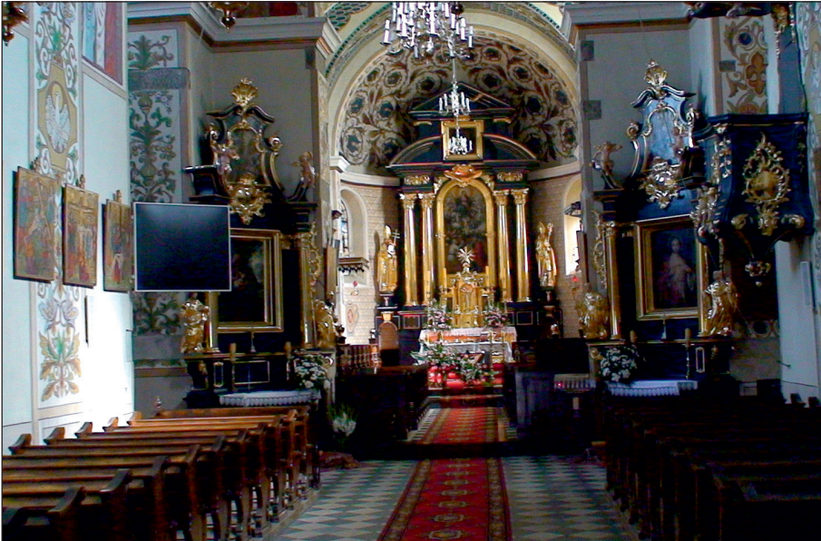
Fot. 1. Wnętrze kościoła w Szczyrzycu