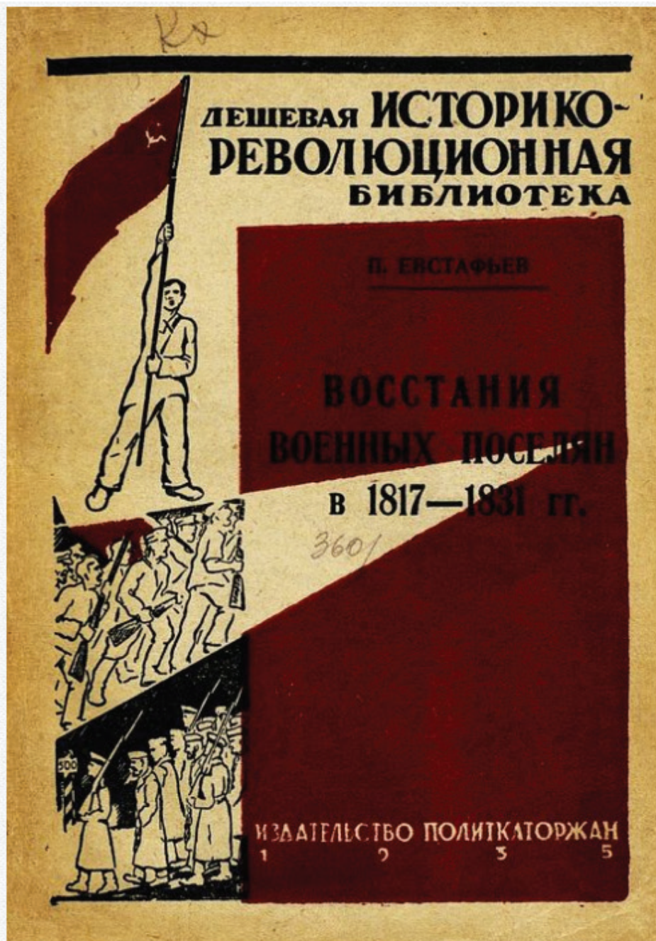
П. 2. Okładka książki П.П. Евстафьев, Восстание военных поселений Новгородской губернии в 1831 г. (Москва 1934)