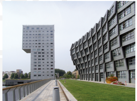
III. 9. Almere – the Wave (building), arch. René van Zuuk; in the distance Silverline designed by Claus en Kaan Architecten

II. 8. Almere – centrum proj. Christian de Portzamparc