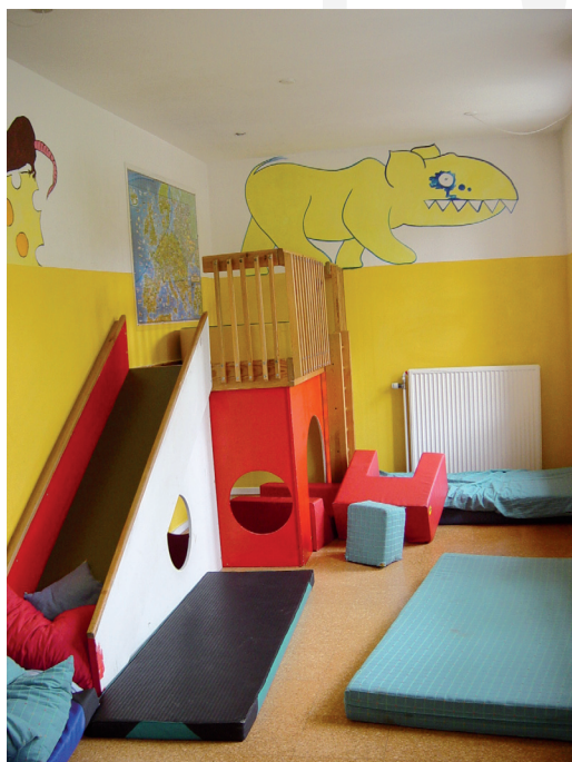
III. 5. Cohousing community of Ibsgaarden in Roskilde. Children's playroom in the community center

II. 4. Wspólnota co-housing Ibsgaarden w Roskilde. Kuchnia do przygotowywania wspólnych posiłków w centrum wspólnotowym