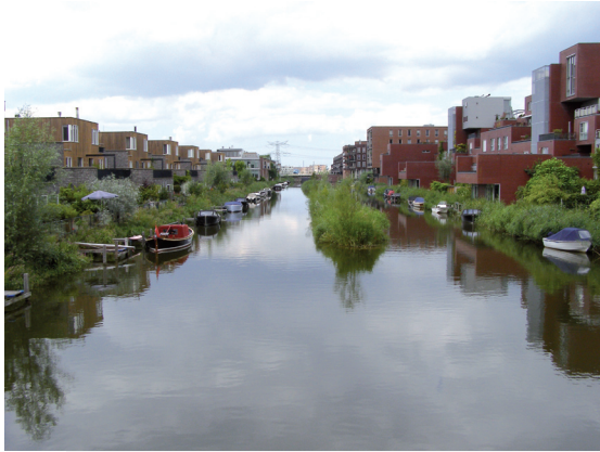
III. 6. IJburg – terraced houses alongside the canal

II. 6. IJburg – zabudowa mieszkaniowa nad kanałem