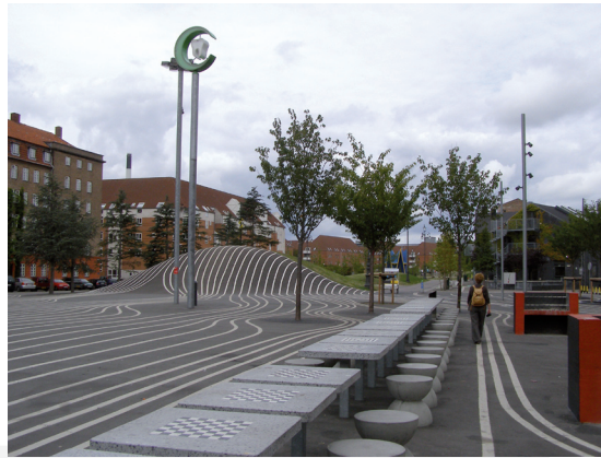
Ill. 17. Copenhagen – Superkilen Urban Park, “the Black Square” by Bjärke Igels Group

Il. 16. Kopenhaga – Plac Superkilen „Zielone wzgórze” proj. Bjärke Igels Group