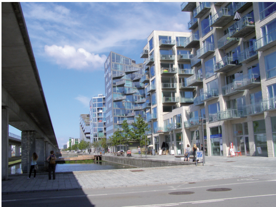
III. 11. Copenhagen – Ørestad. Frontage – Ørestad – Boulevard. The buildings designed by Bjarke Ingels Group