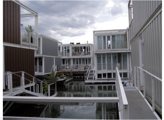
III. 7. IJburg – water-based houses

II. 6. IJburg – zabudowa mieszkaniowa nad kanałem