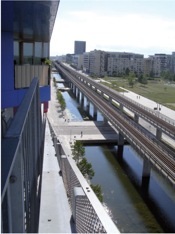
III. 10. Copenhagen – Ørestad. Communication axis