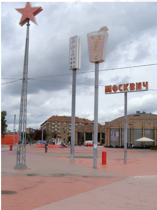
Ill. 18. Copenhagen – Superkilen Urban Park, “the Red Square” by Bjärke Igels Group

Il. 17. Kopenhaga – Plac Superkilen „Czarny Plac” proj. Bjärke Igels Group