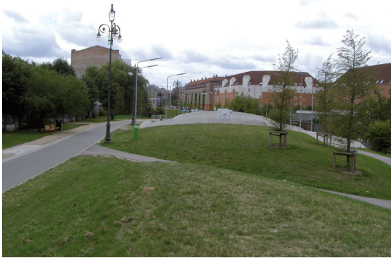
Ill. 16. Copenhagen – Superkilen Urban Park, “Green Park” by Bjärke Igels Group

Il. 16. Kopenhaga – Plac Superkilen „Zielone wzgórze” proj. Bjärke Igels Group