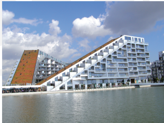
III. 12. Copenhagen – Ørestad. 8 House (Danish: 8 Tallet) designed by Bjarke Ingels Group