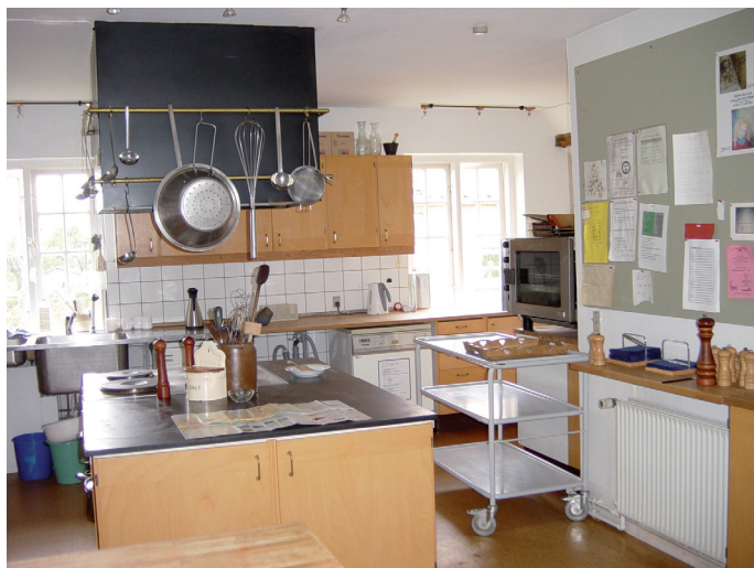
III. 4. Cohousing community of Ibsgaarden in Roskilde. The kitchen for preparing shared meals in the community center

II. 4. Wspólnota co-housing Ibsgaarden w Roskilde. Kuchnia do przygotowywania wspólnych posiłków w centrum wspólnotowym