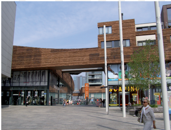
III. 8. Almere – the center designed by Christian de Portzamparc

II. 7. IJburg – domy na wodzie