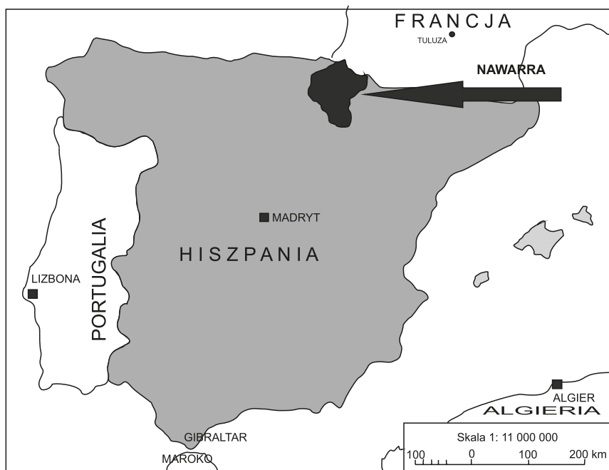
Ryc. 1. Obszar badań