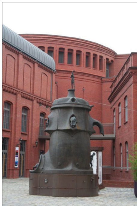
Il. 3. Główne wejście do Starego Browaru w Poznaniu (po lewej) oraz elementy zagospodarowania Dziedzińca Sztuki (po prawej)