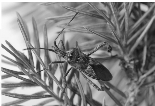
III. 3. Western conifer seed bug Leptoglossus occidentalis

Conducted observations lead to the conclusion that the discussed species of ‘new’ invasive phytophaga prefer mature specimens of trees and often inhabit historic parks. Their feeding affects the aesthetic value of the stand, however, to a much lesser extent than in the case of the well-known Horse-chestnut leaf miner. The further development of the population of Corythucha ciliata may raise the biggest concern. Their intensive feeding can lead to very significant destruction of assimilation apparatus of plane trees.