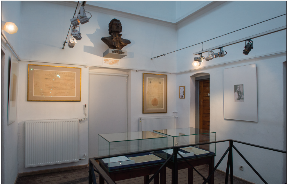
II. I. Widok fragmentu wystawy rysunków autorstwa Tadeusza Kościuszki w Muzeum PK z widocznymi w tle kopiami dokumentów nominacyjnych: Kongresu amerykańskiego i Króla Polski.