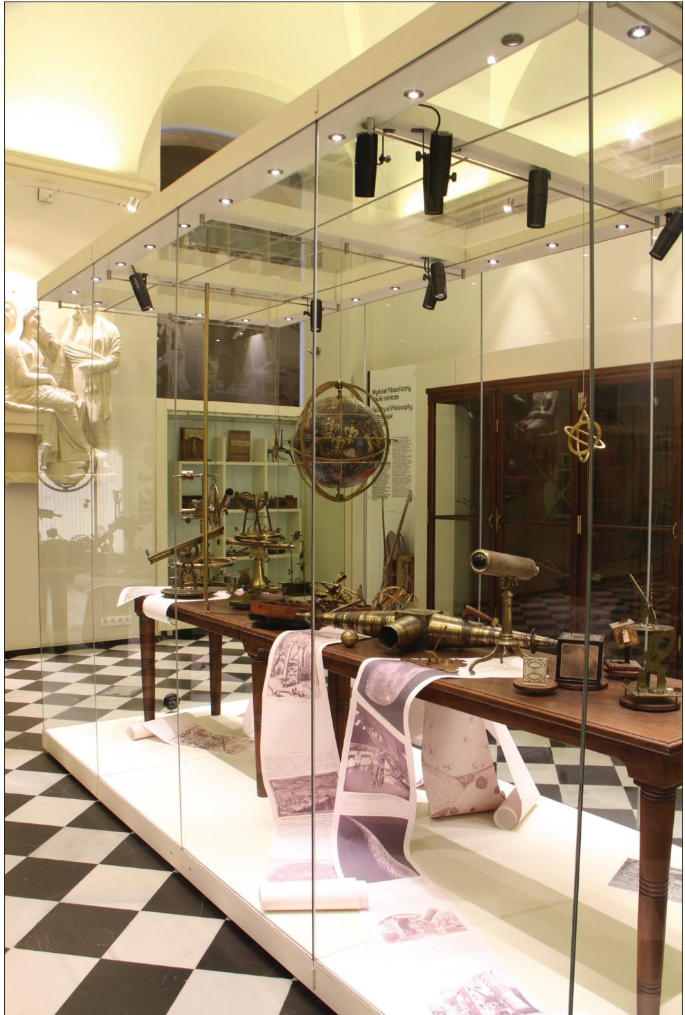
Il. V. Sala im. Stefana Banacha.