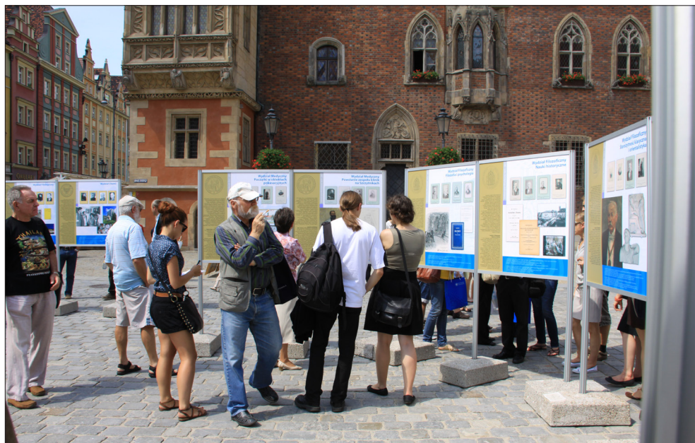
II. 2. Wystawa „Uniwersytet Wrocławski 1811–2011” na Rynku wrocławskim, sierpień 2011 roku.

z tomów Księgi jubileuszowej , której redakcji podjął się prof. Harasimowicz we współpracy z pracownikami Muzeum 9 . W listopadzie 2011 roku Muzeum zorganizowało również międzynarodowe kolokwium „Między wiedzą a władzą. Uniwersytet wobec przekształceń państwa”, na które zaproszono wybitnych uczonych z Polski, Niemiec, Wielkiej Brytanii, Stanów Zjednoczonych, Izraela i Azerbejdżanu.