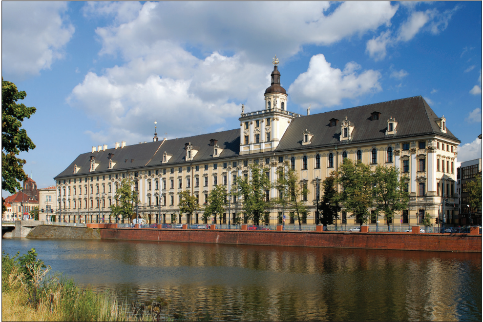
Il. I. Uniwersytet Wrocławski, widok od strony Odry.