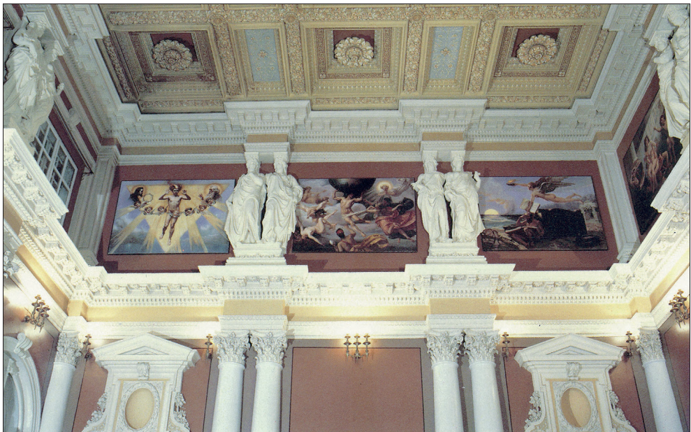
II. II. Widok ogólny malowideł ściennych w Auli Politechniki Lwowskiej wykonanych wg projektu Jana Matejki.