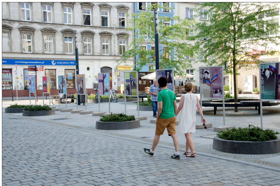
II. 3. Wystawa „Profesorskie ulice”, ul. Kuźnicza we Wrocławiu, sierpień 2015 roku.

szym poziomie Wieży Matematycznej 12 oraz w przestrzeni publicznej 13 (il. 3). W 2015 roku uruchomiono na drugim poziomie wystawienniczym Wieży wystawę poświęconą powojennym fizykom Uniwersytetu Wrocławskiego, na której pokazano m.in. mikroskopy fizyczne.