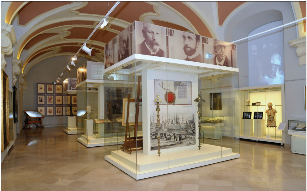
Il. II. Sala im. Romana Longchamps de Bérrier.