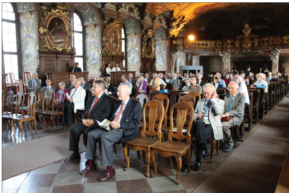
Il. IV. Otwarcie konferencji „Uniwersytet Wrocławski w kulturze europejskiej XIX i XX wieku”, Aula Leopoldina, 4.10.2011.