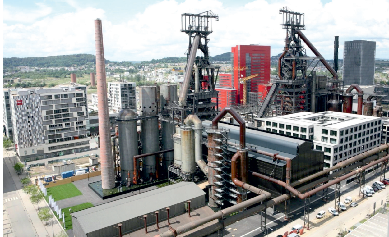
Il. 2. Widok na część Nowego Belval z zachowanymi relikwiami dawnej huty, między które wkomponowano nową strukturę urbanistyczną. W tle widoczny czerwony biurowiec Dexia BL/View of a part of New Belval with preserved relics of the former steelworks, between which a new urban structure has been embedded. In the background – a red office building of Dexia BL

dzinną i rekreacyjną. Główną osnową założenia jest postindustrialny charakter uzupełniony nowoczesną zabudową. Tym, co wyróżnia proces rewitalizacji dawnej huty Belval, jest jej kompleksowość – zarówno pod względem administracyjnym, komercyjnym jak i społecznym – oraz podejście do zastanej struktury pohutniczej.