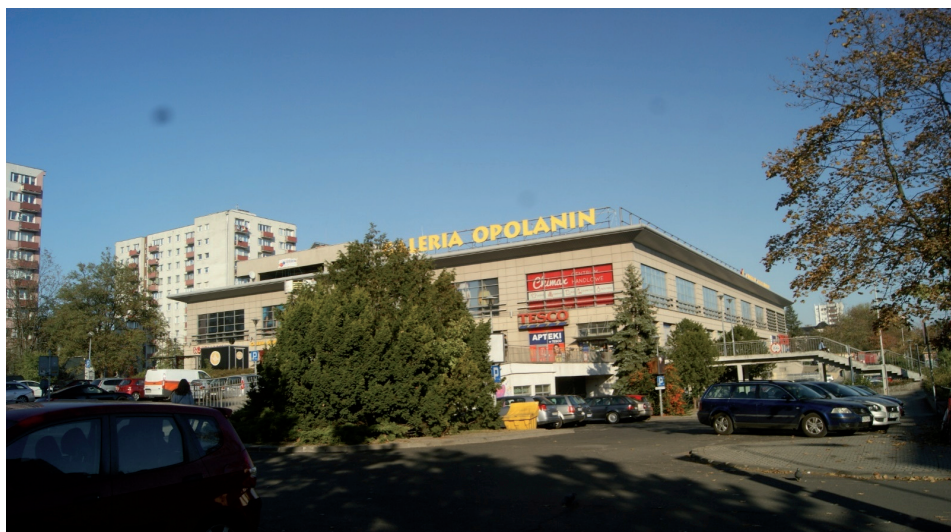
Il. 3. Nowoczesna galeria handlowa „Opolanin”.

Od listopada 1972 r. trwała budowa nowej siedziby Instytutu Śląskiego przy ul. Piastowskiej 48 . Według oceny zawartej w referacie przygotowanym na wrześnieowe plenum KW PZPR w tymże roku, budowa posuwała się jednak „w złotym tempie” 49 . W myśl pierwotnych planów obiekt ten, zaprojektowany jako ośmiokondygnacyjny biurowiec, miał być oddany do użytku w czerwcu 1975 r. 50 Niestety realizacja inwestycji zaczęła się opóźniać z powodu błędów w dokumentacji, a także w związku z wadliwym wykonaniem prefabrykatów budowlanych 51 . W marcu 1976 r. budynek w stanie surowym był gotowy w 70 proc 52 . Latem tegoż roku bliżej nieokreślone gremium zdecydowało jednak o zmianie przeznaczenia budynku, nazywanego domem