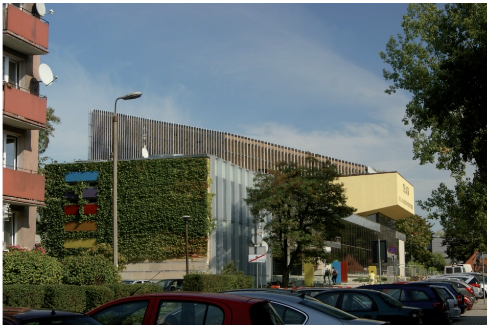
Il. 1. Teatr im. Jana Kochanowskiego w Opolu, oddany do użytku w 1975 r.

Tymczasem w całym kraju zaczęły narastać problemy z realizacją rozpoczętych zadań inwestycyjnych. Budowano zbyt wiele obiektów naraz w stosunku do posiadanych funduszy i mocy przerobowych. W 1974 r. nie udało się zrealizować planu rocznego w przypadku trzydziestu spośród trzydziestu siedmiu zadań zaliczanych do inwestycji ważnych dla województwa opolskiego. W lutym 1975 r. Sekretariat KW PZPR w Opolu zwrócił uwagę na „niewykonywanie planu przez przedsiębiorstwa budowlane, a głównie w budownictwie mieszkaniowym” 28 . Bardzo źle przedstawiała się również sytuacja na budowach nowej siedziby Instytutu Śląskiego oraz Instytutu Chemii WSP w Opolu, gdzie zaawansowanie robót wynosiło odpowiednio 21,0 i 21,8 proc. 29