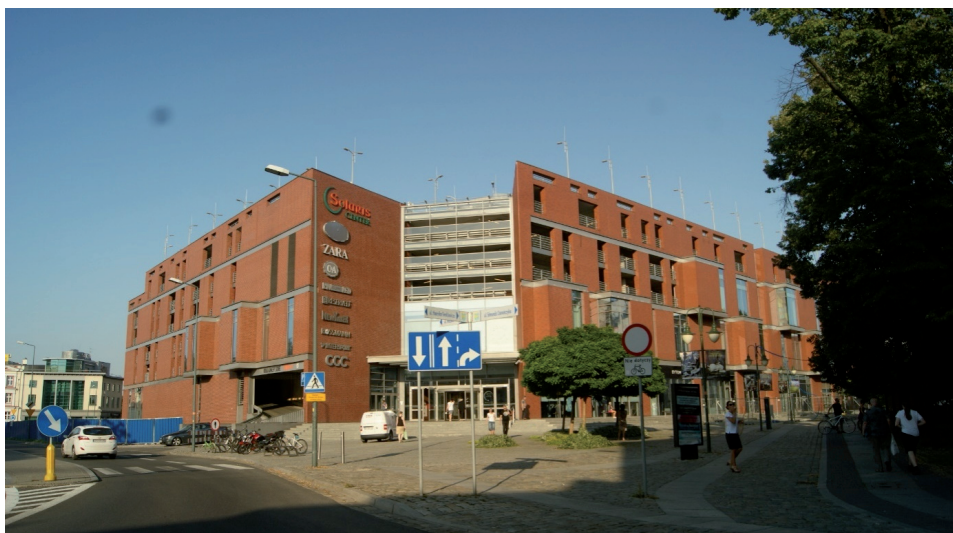
Il. 5. Galeria handlowa „Solaris”, zbudowana na miejscu dawnego browaru.

w latach siedemdziesiątych zamierzano wybudować nową siedzibę, ale brak środków nie pozwolił na realizację tych zamierzeń 55 .