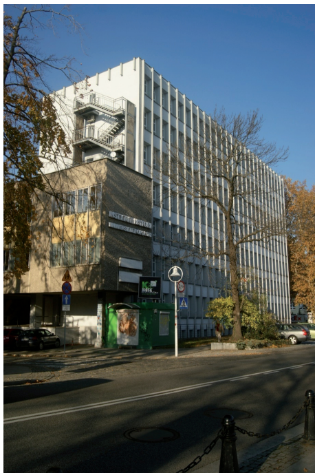
Il. 6. Gmach Instytutu Śląskiego.