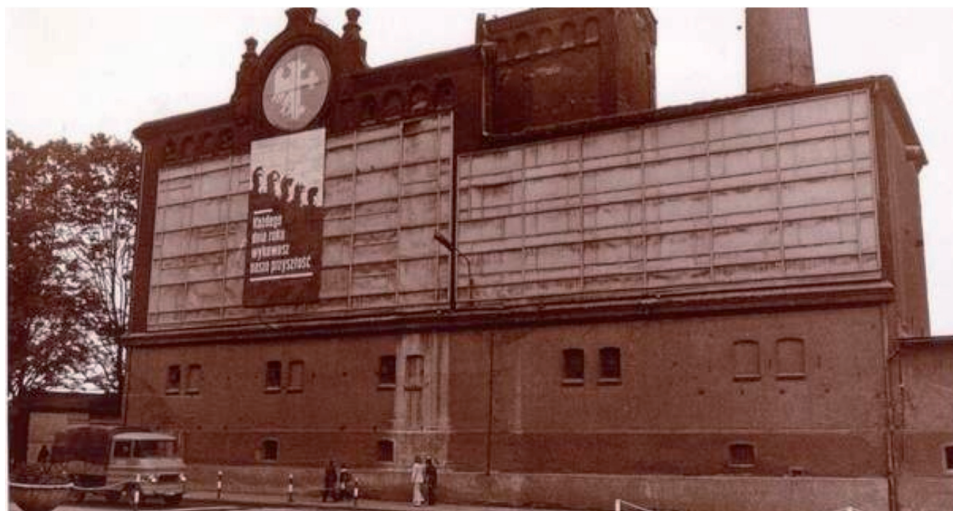
II. 4. Browar w Opolu. Fotografia archiwalna.

społecznym, postanawiając, że będzie się w nim mieścić siedziba Komitetu Wojewódzkiego i Komitetu Miejskiego PZPR. Pociągnęło to za sobą istotne zmiany w projekcie o charakterze rozszerzającym, wraz z koniecznością wyburzenia sąsiednich budynków 53 . W ten sposób interesy aparatu partyjnego zostały postawione ponad potrzebami miejscowego środowiska naukowego.