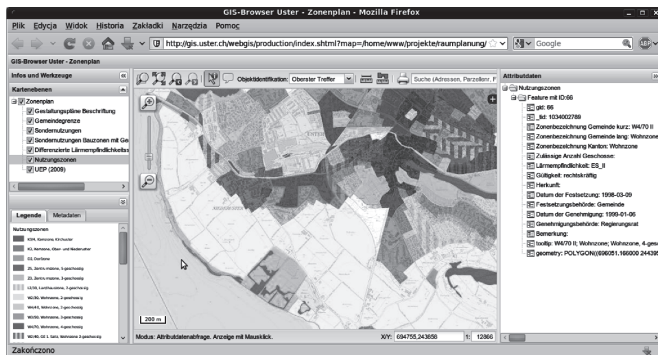
Rys. 3. Fragment miasta Uster (Szwajcaria) wyświetlany w środowisku klienta sieciowego QGIS Fig. 3. Part of Uster city (Switzerland) displayed in QGIS web client environment

wany jest ten ostatni. To właśnie Python poprzez łatwość implementacji stał się ulubionym środowiskiem rozbudowy programu przez użytkowników – użytkowników, a nie programistów. Twórcy projektu zadbali bowiem o wtyczkę, która ułatwia początkującym tworzenie wtyczek oraz przygotowali prosty podręcznik programowania wtyczek [1].