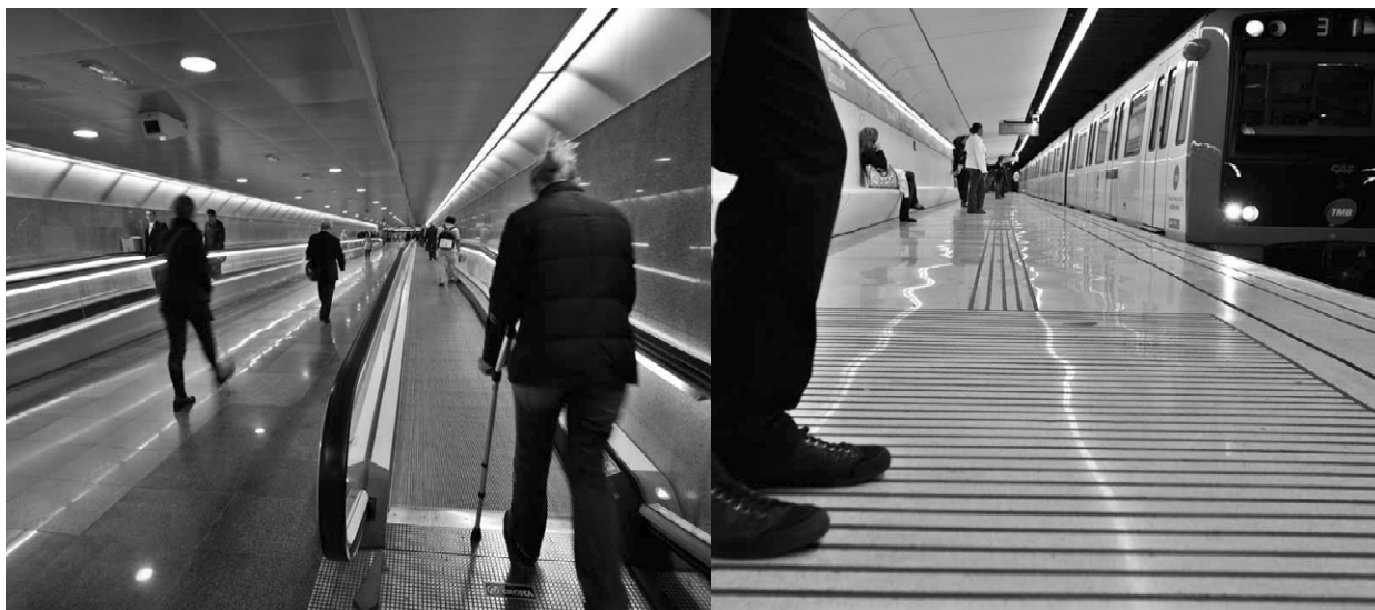
Ryc. 1. Innowacje w transporcie miejskim Barcelony

Istnieją także inne udoskonalenia, jak zainstalowanie głosowych automatów biletowych w całej sieci komunikacji miejskiej, wypukłych nawierzchni chodnikowych z wykorzystaniem metody ‘via dot’, które informują osoby niewidome o niebezpieczeństwie – zbliżaniu się do krawędzi peronu, jezdni (ryc. 1).