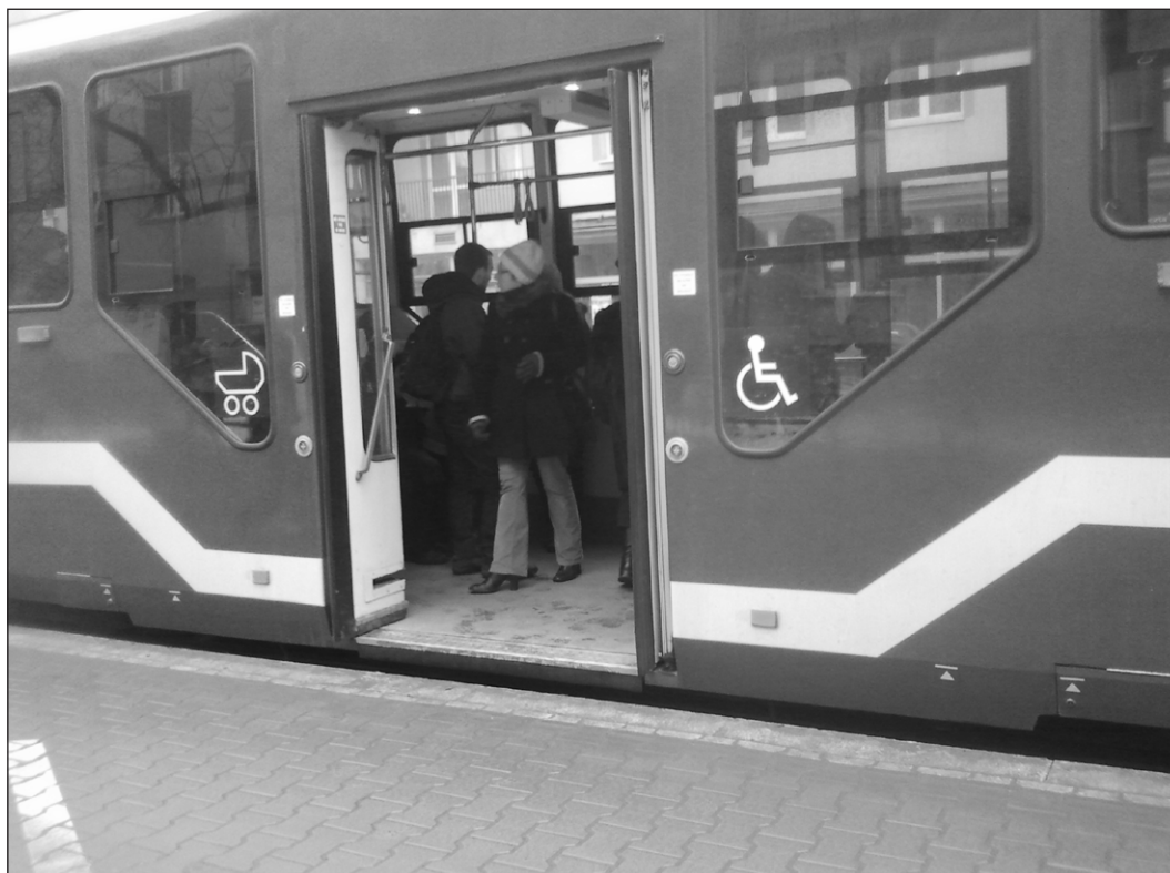
Ryc. 3. Dodatkowe przyciski dla osób niepełnosprawnych; tramwaj niskopodłogowy i podwyższona platforma na przystankach ułatwiająca wsiadanie