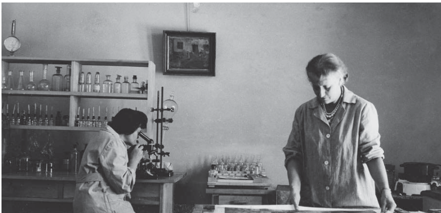
1. Pracownia konserwacji w Sukiennicach, 1965 r.