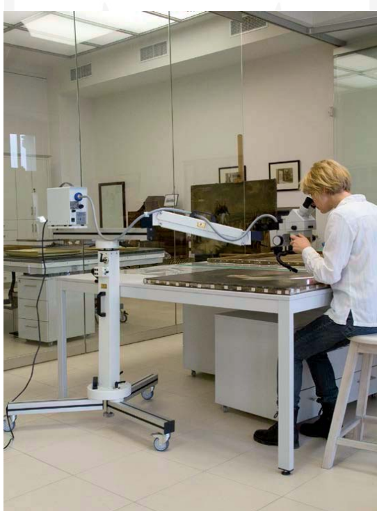
Pracownia Konserwacji Malarstwa i Rzeźby w Sukiennicach, (foto. E. Zygier 2012 )