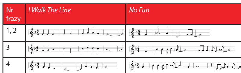
Tabela 5. Porównanie odpowiadających sobie fraz muzycznych w I Walk The Line oraz No Fun .

Punkty krańcowe fraz również świadczą o podobieństwie w budowie melodycznej: w zwrotkach obu utworów wszystkie cztery frazy (przy czym w obydwu wypadkach fraza druga jest powtórzeniem pierwszej) zaczynają się dźwiękiem o tej samej wysokości i tak samo kończą, co ilustruje tabela 5.