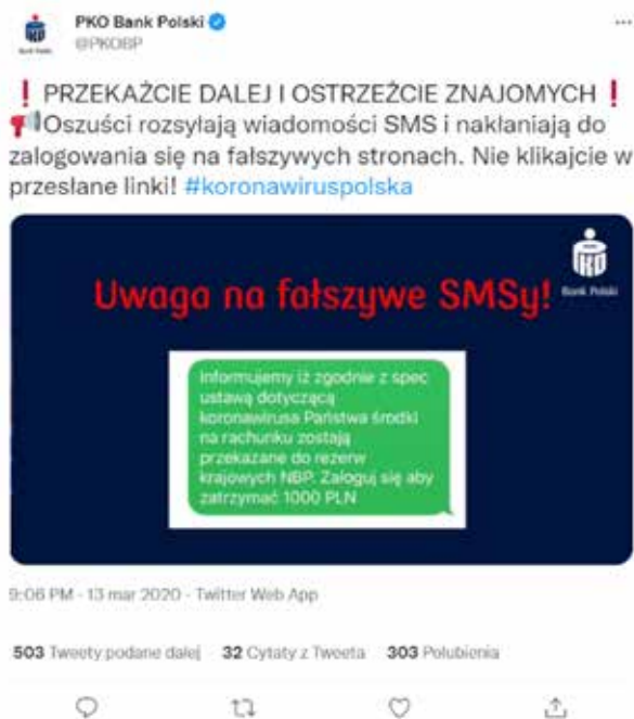
Grafika 4. Print screen z konta PKO Bank Polski na portalu społecznościowym Twitter.