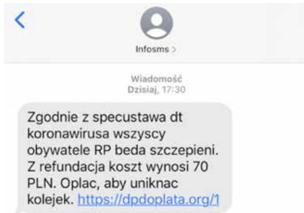
Grafika 6. Print screen z portalu Zaufana Trzecia Strona.

Tego samego dnia pojawiła się jeszcze jedna kampania, której celem było wyłudzenie pieniędzy od klientów banków (grafika 6).