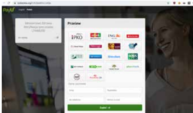
Grafika 5. Print screen z portalu Zaufana Trzecia Strona.