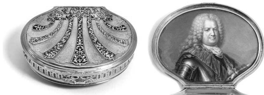
Fot. 3. Złota tabakiera z portretem króla na wewnętrznej stronie. To o niej najprawdopodobniej wspominał szwedzki medyk w liście do Wersalu