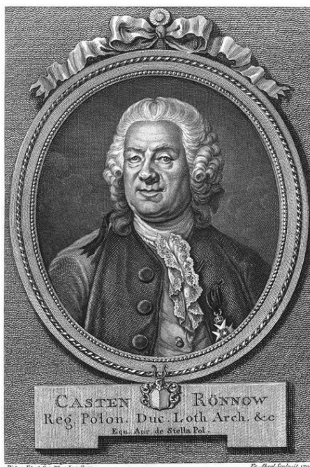
Fot. 1. Portret Casten Rönnowa, Litografia nieznanego artysty z 1793 r.