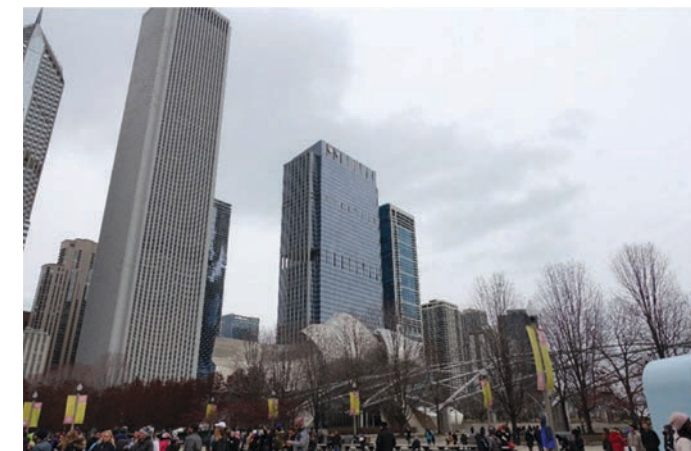
Il. 5. Jay Pritzker Pavilion Millennium Park Chicago. Fot. autor sierpień 2016 / Jay Pritzker Pavilion Millennium Park Chicago. Original photograph, August 2016