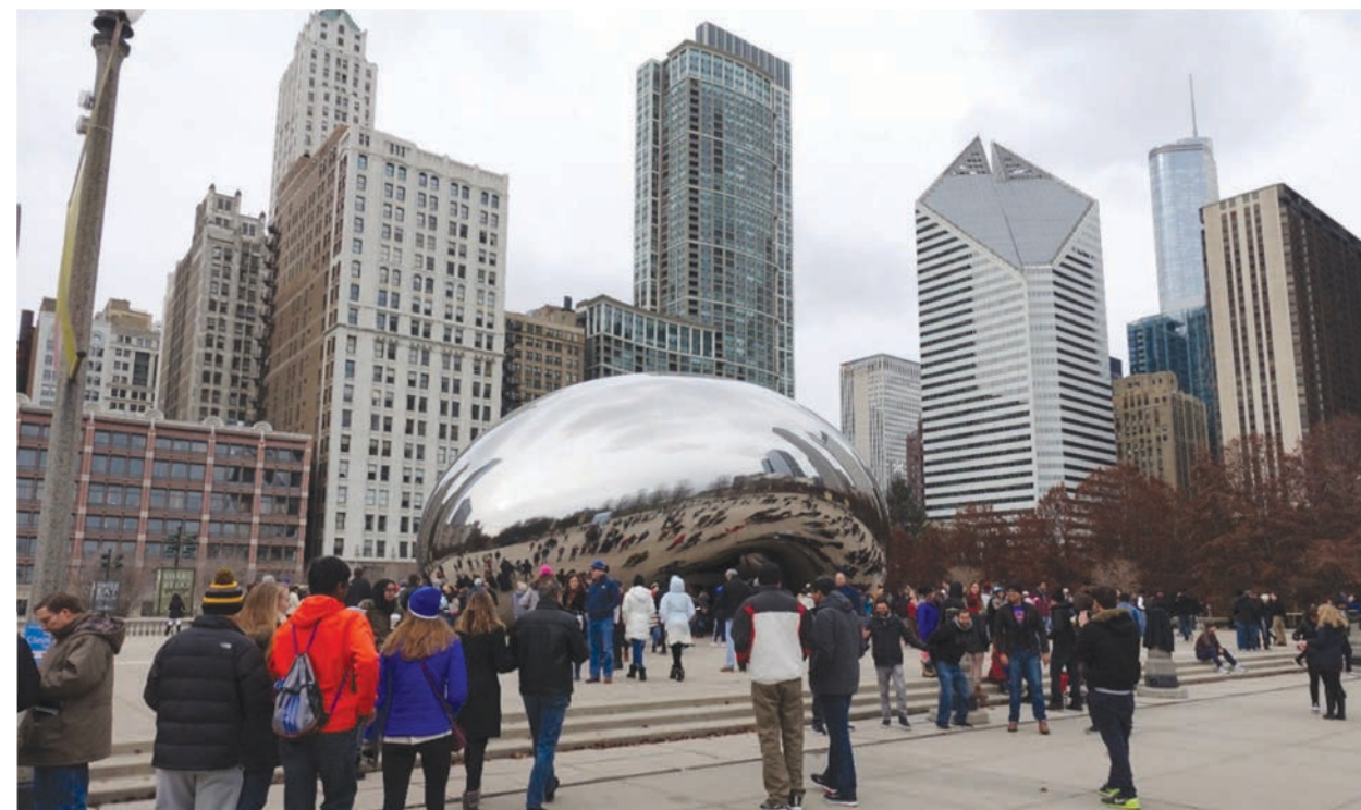
Il. 6. Cloud Gate, Millenium Park Chicago Fot. autor. grudzień 2016 / Cloud Gate, Millennium Park Chicago Original photograph, December 2016