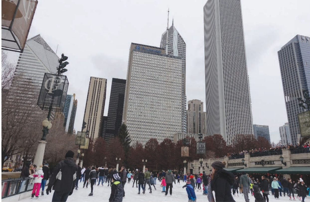
Il. 9. Lodowisko w zimie w pobliżu Bramy Chmury. Millenium Park, Chicago, fot. autor grudzień 2016 / The winter ice skating rink near Cloud Gate, Millennium Park, Chicago. Original photograph, December 2016

nizowane są Letnie Festiwale Filmowe, które przyciągają mieszkańców Chicago i turystów do Parku Millennium. Widzowie mogą odpocząć i cieszyć się oglądając wiele znanych, klasycznych filmów w pawilonie Jay Pritzкера lub na kocu na trawie.