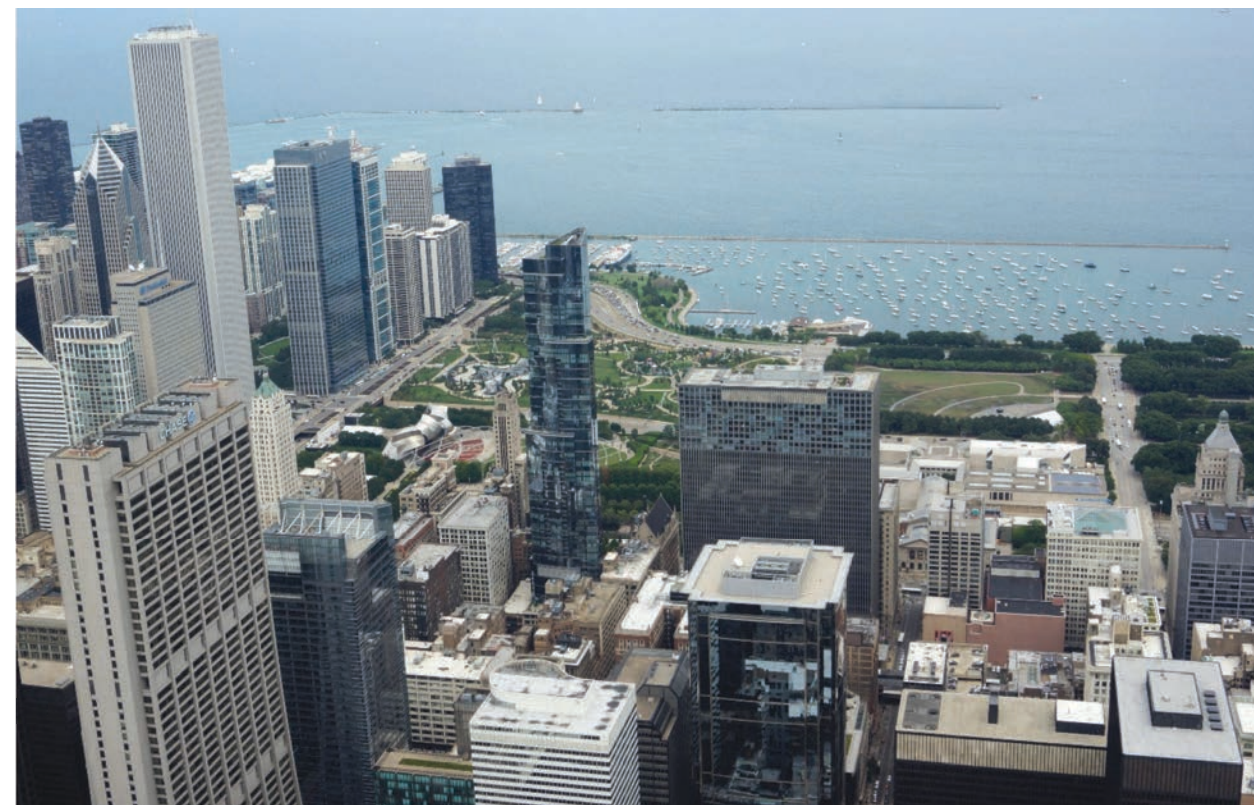
Ill. 2. View of the surroundings of Millennium Park in Chicago. Original photograph, August 2016