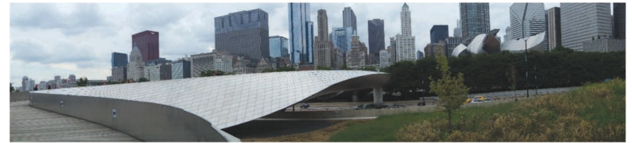
Il. 10–11. Widok na Millenium Park, Chicago. Fot. autor. sierpień 2016 / View of Millennium Park, Chicago. Original photograph, August 2016