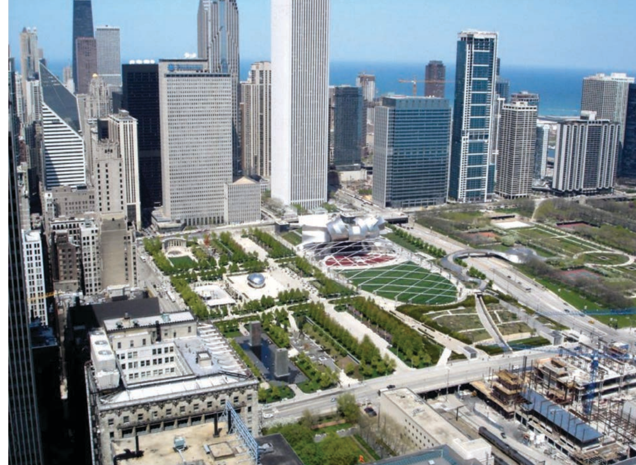
Il. 1. Millennium Park Chicago http://www.greenroofs.com/projects/pview.php?id=459 , dostęp: 20.08.2018

Cities form a spatial structure within which various human interactions are played out. Thanks to them it is possible to maintain social ties, organise public life and satisfy various needs and aspirations. Satisfying the needs of the users of a given space, who have different views, incomes, lifestyles, age and education causes a given urban space to be-