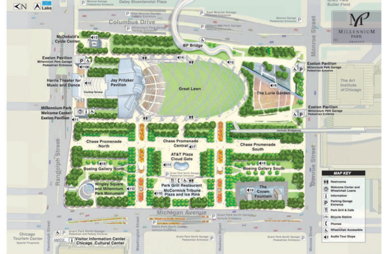
Il. 3. Map of Millennium Park | Plan Your Experience | The Grant Park Music Festival https://www.grantparkmusicfestival.com/.../map-of-millennium-pa , dostep: 20.08.2018

Millennium Park zostało otwarte 16 lipca 2004 r. i jest niezwykle popularnym miejscem w Chicago, bardzo chętnie odwiedzanych o każdej porze roku i o każdej porze dnia przez mieszkańców i turystów.