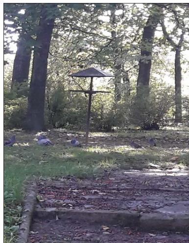
Zdjęcie 3. Domki dla ptaków zlokalizowane na terenie osiedla mieszkaniowego

W ramach świadczenia pracy socjalnej można byłoby zatem tworzyć koalicje na rzecz inicjowania rozwiązań, tak by w przestrzeni osiedla ludzie mogli swobodnie, bez kolizji z interesami innych mieszkańców, zaspokajać swoje potrzeby. Na przykład wspólnie z mieszkańcami można ustalić i oznaczyć miejsca, w których dopuszcza się karmienie ptaków (zdjęcie 3) i/lub kotów (zdjęcie 4).