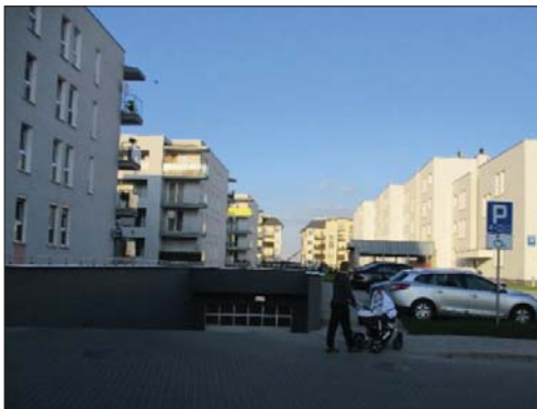
Zdjęcie 6. Przykłady rozwiązań pozwalających na sprawiedliwe i niestygmatyzujące użycie przestrzeni