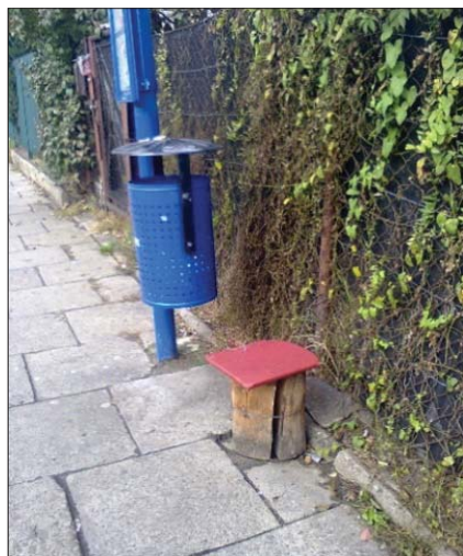
Zdjęcie 1. Przykłady „meblowania przestrzeni” przez mieszkańców

Badani w różny sposób dawali wyraz zainteresowaniu sprawami osiedlowymi. Zwłaszcza osoby starsze nie pozostawały obojętne na zachowania, które uznały za niewłaściwe, jak łamanie nieformalnych zasad i regulaminów blokowych oraz osiedlowych. Nie były też bierne wobec wadliwych, ich zdaniem, sposobów projektowania i organizacji przestrzeni. Zidentyfikowane praktyki w tym zakresie uznałam za istotne zmienne ujawniające potrzeby i potencjał tkwiący w lokalnej społeczności, co jest ważne z punktu widzenia działań pomocowych. Kategoryzując działania mieszkańców, rozpocznę od tych innowacyjnych, rozwojowych i modernizacyjnych. Ich głównym celem było wywołanie zmiany, poprawa funkcjonowania osiedla i jego mieszkańców. Polegały one na przykład na zgłaszaniu oferty usług i pomysłów na zagospodarowanie przestrzeni (do administracji osiedla, Rady Dzielnicy, Urzędu Miasta). Jedną z takich zgłoszonych i realizowanych przez mieszkankę inicjatyw jest Klub Seniora, który korzysta z lokalu należącego do spółdzielni. To także sygnalizowanie administracji niedoboru ławek, braku podjazdów. Innym razem to samowolne obsadzanie terenu drzewami, organizowanie przyblokowych ogródków. Szczególną formą interwencji mieszkańców w osiedlową przestrzeń jest jej „meblowanie”, na przykład ustawianie na przystanku autobusowym stołka (zdjęcie 1) czy pufy w pobliżu wejścia do klatki schodowej (zdjęcie 2).