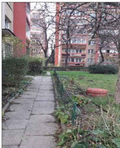
Zdjęcie 2. Przykłady „meblowania przestrzeni” przez mieszkańców