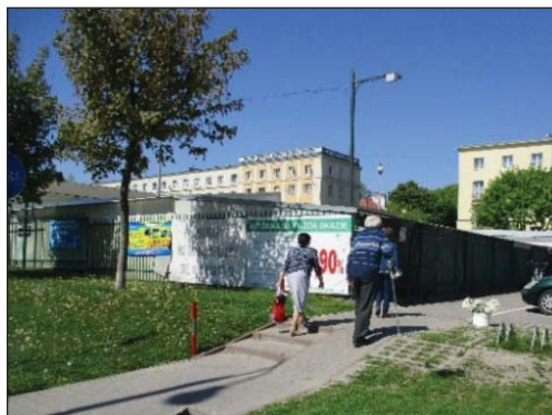
Zdjęcie 5. Przykłady rozwiązań pozwalających na sprawiedliwe i niestygmatyzujące użycie przestrzeni