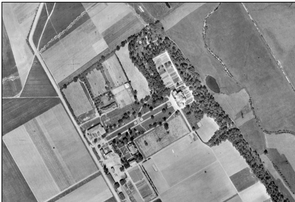
II. 1. Ursynów – stan obiektu w 1939 roku 7