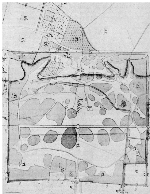
II. 2. Plan parku natolińskiego: a) stan z 1810, b) stan w latach 1858–1860 22