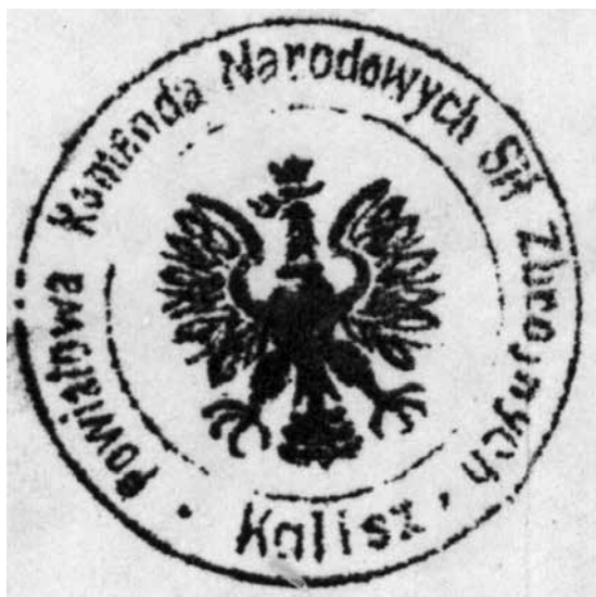
4. Odcisk pieczęcie Powiatowej Komendy NSZ w Kaliszu