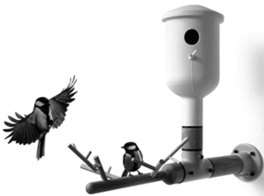
Il. 1: Vincent Bos, 2011, elementy ogrodowe przeznaczone dla ptaków.