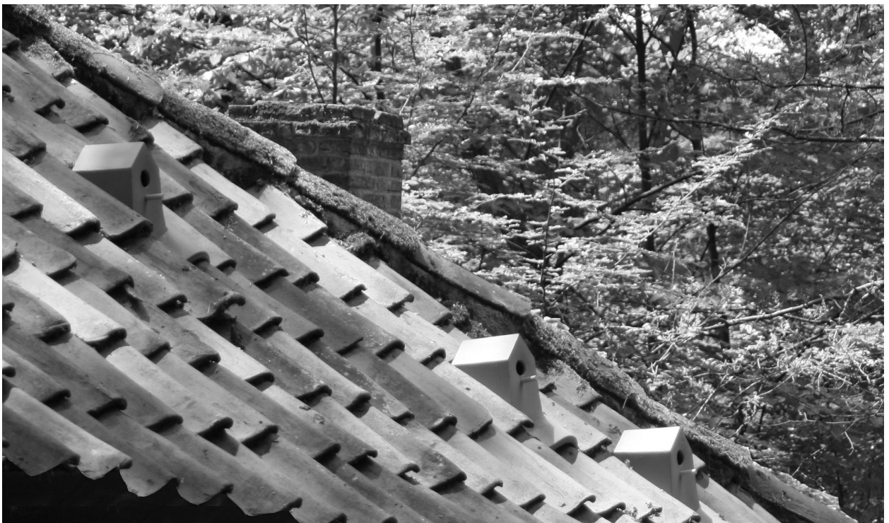
Ill. 2. Klaas Kuiken, 2009, the birdhouse – a ceramic tile used for nesting without disturbing the structure and maintaining the tightness of the roof. Image courtesy of Klaas Kuiken, author: Klaas Kuiken