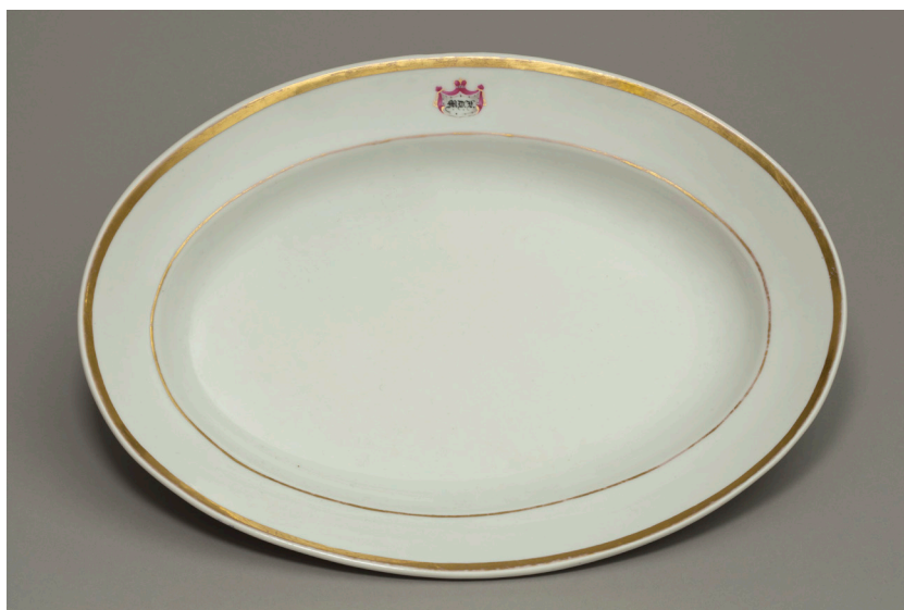
II. 4. Owalny półmisek z monogramem MD.L. , MUJ, nr inw. 18007,7180/IV.