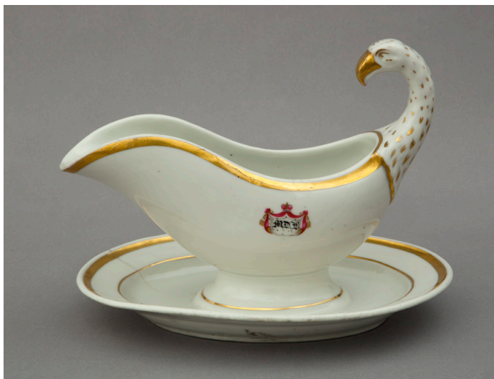
II. 3. Sosjerka z uchwytem w formie głowy orła i monogramem MD.L. , MUJ, nr inw. 18012,7185/IV.