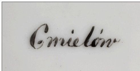
II. 7. Sygnatura pod dnem sosjerki z uchwytem w formie głowy orła i monogramem MD.L. , MUJ, nr inw. 18012, 7185/IV.