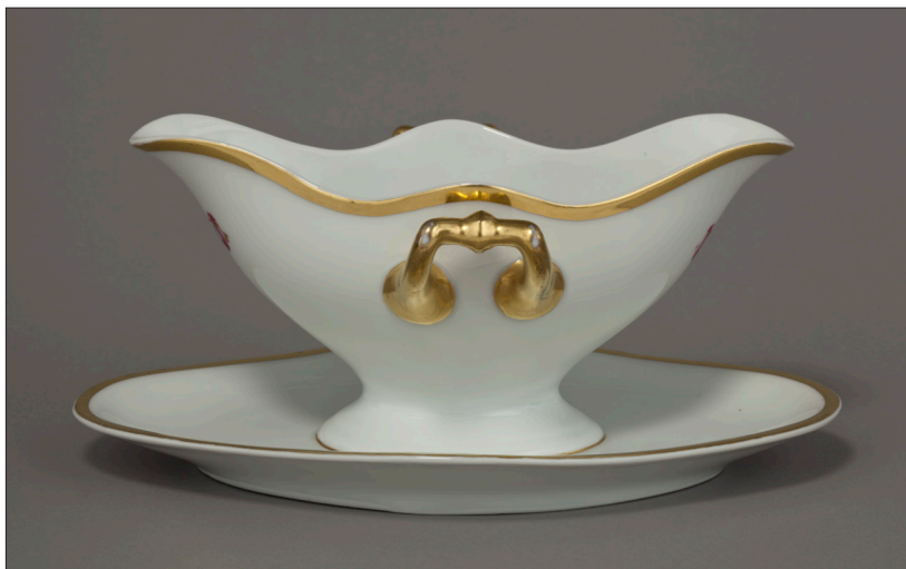
II. 12. Sosjerka z monogramem M.D.L. , MUJ, nr inw. 18010, 7183/IV.