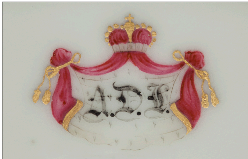
II. 9. Monogram A.D.L. MUJ, nr inw. 18009, 7182/IV.