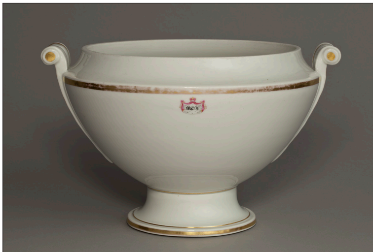
II. 1. Duża waza do zupy z monogramem MD.L. , MUJ, nr inw. 18014,7187/IV.