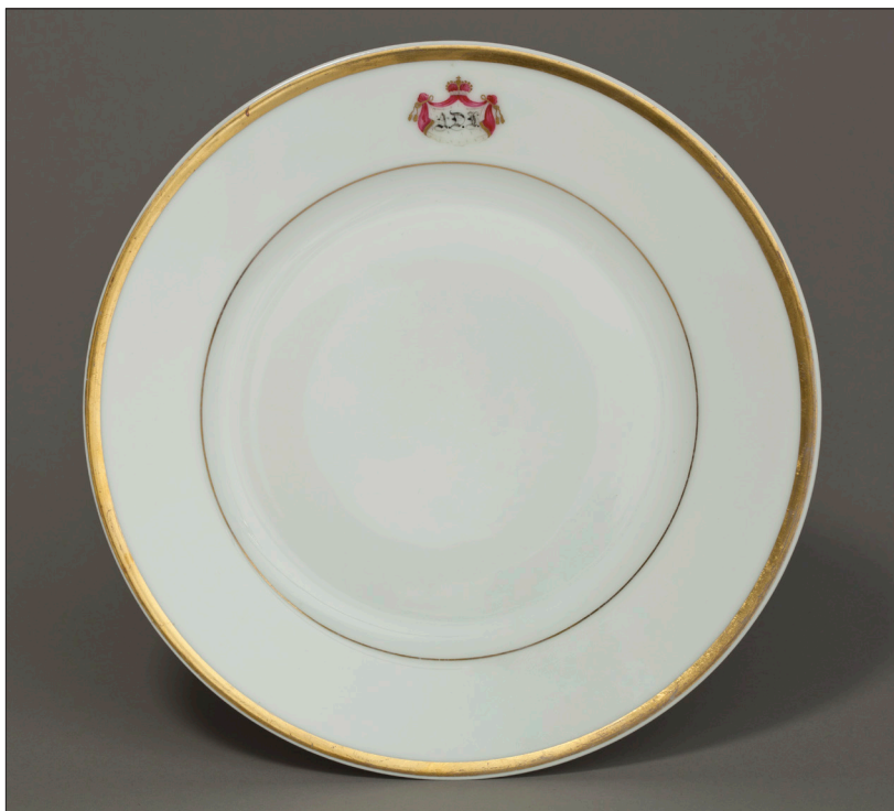
II. 8. Talerz płytki z monogramem A.D.L. , MUJ, nr inw. 18009, 7182/IV.