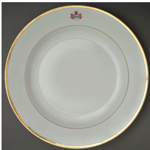
II. 11. Półmisek okrągły z monogramem M.D.L. , MUJ, nr inw. 18005, 7177/IV.