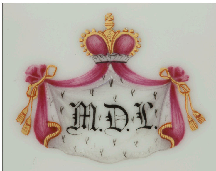
II. 13. Monogram M.D.L. , MUJ, nr inw. 18005, 7177/IV.