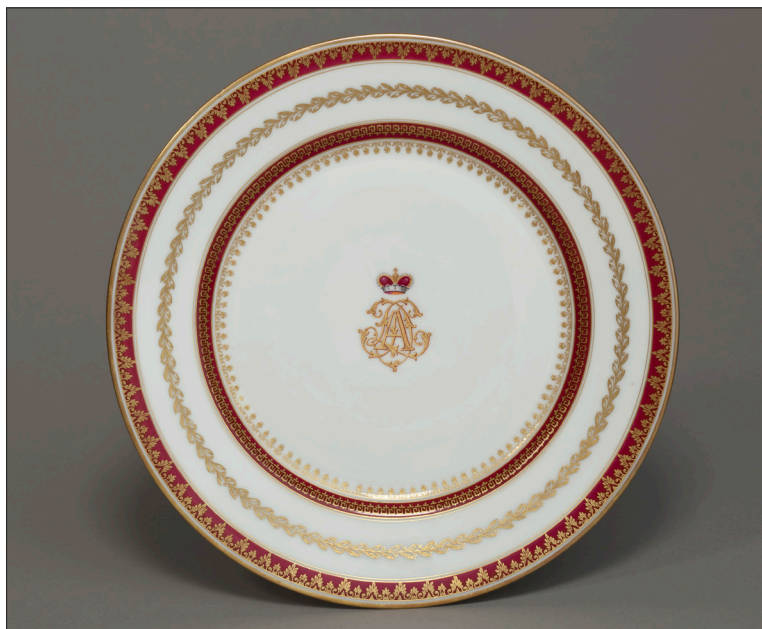
II. 14. Talerz płytki z monogramem ADL w ligaturze, MUJ, nr inw. 18046/1, 7194/IV