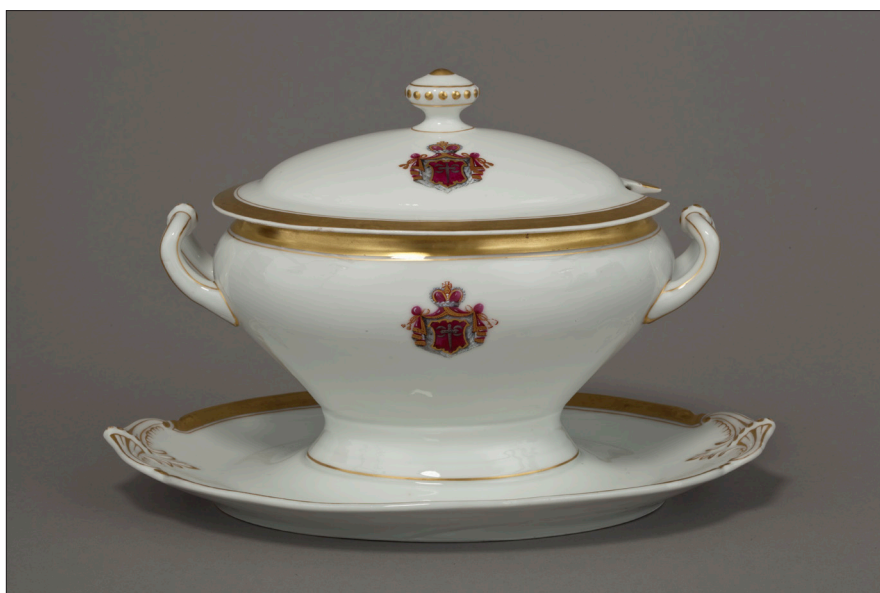
II. 18. Sosjerka z herbem Druck, MUJ, nr inw. 18015, 7188/IV.