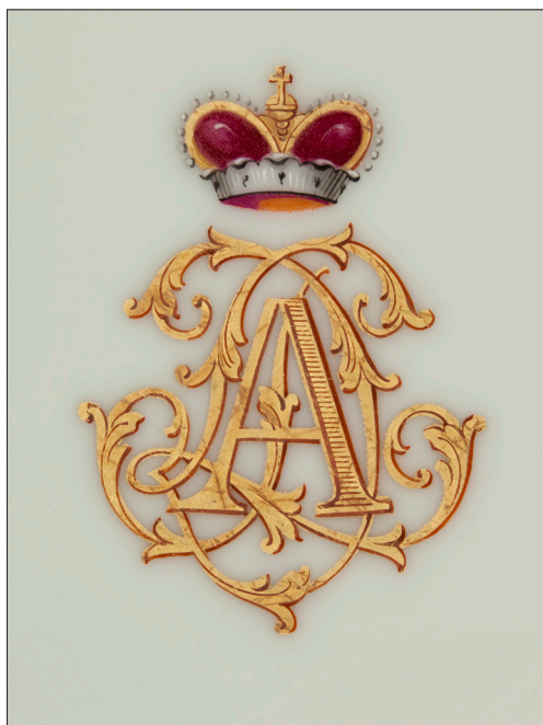
II. 15. Monogram ADL w ligaturze, MUJ, nr inw. 18046/1, 7194/IV.