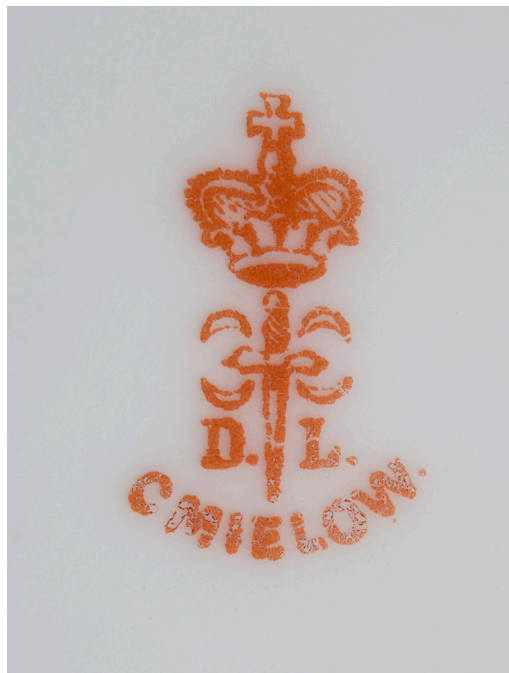
Il. 16. Sygnatura pod dnem talerza z monogramem ADL , MUJ, nr inw. 18046/11, 7204/IV

Dwa okrągłe półmiski i sosjerka są tak samo sygnowane znakiem w nadruku w czerwieni żelaza: herb Druck, po obu jego stronach inicjały D.-L. , nad herbem mitra książęca, pod nim po łuku CMIELOW . Znak używany w latach 1900–1914 108 .