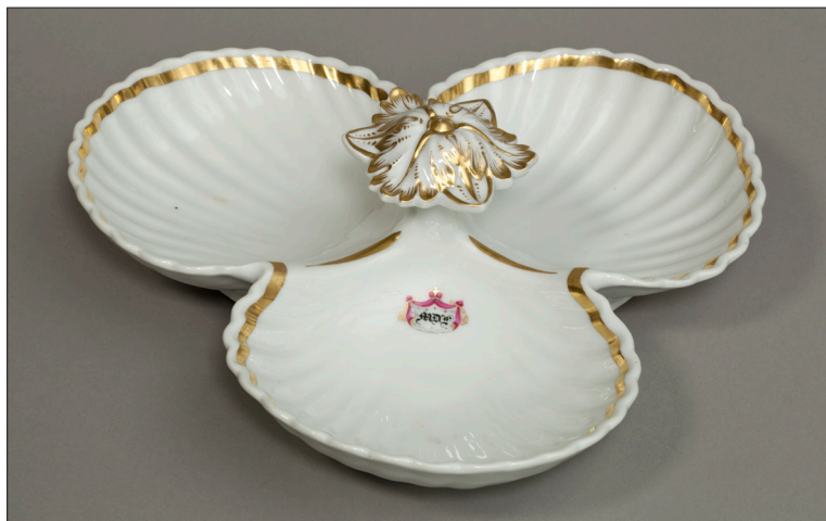
II. 5. Kabaret z monogramem MD.L. , MUJ, nr inw. 18011, 7184/IV.