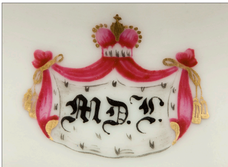
II. 6. Monogram MD.L. z pokrywki wazki, MUJ, nr inw. 18013, 7186/IV.