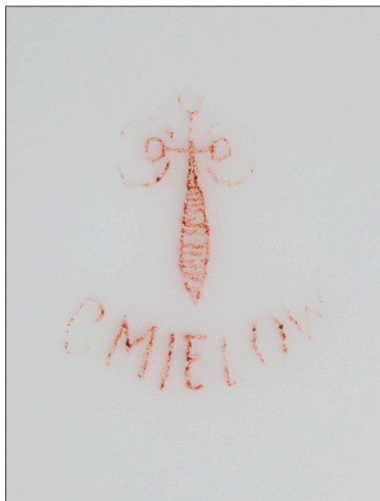
II. 10. Sygnatura pod dnem talerza z monogramem A.D.L. , MUJ, nr inw. 18009, 7182/IV.