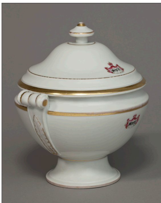
II. 2. Mała waza do zupy z monogramem MD.L. , MUJ, nr inw. 18013,7186/IV.