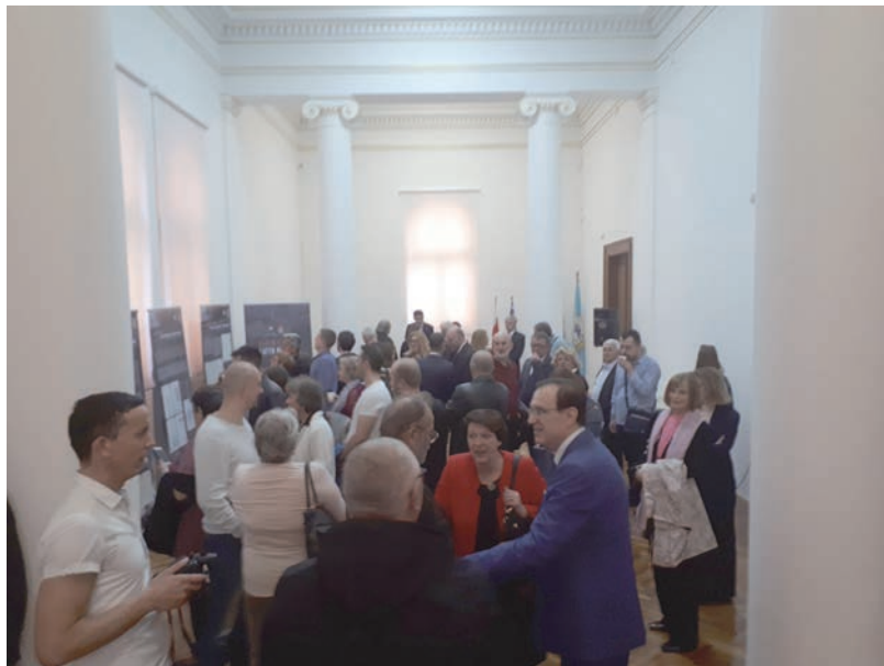
Uroczystość otwarcia wystawy w gmachu Muzeum Narodowego Bośni i Hercegowiny, 13 kwietnia 2018