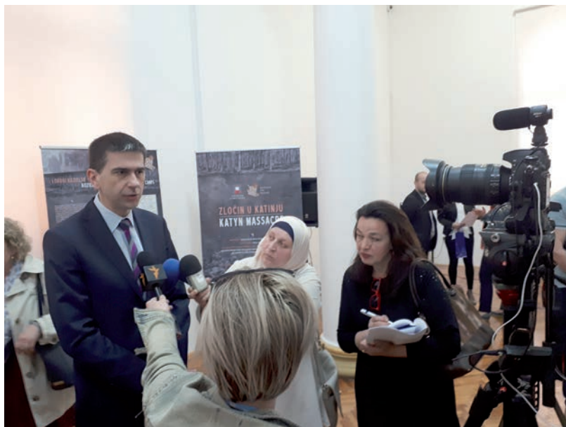
Uroczystość otwarcia wystawy, 13 kwietnia 2018