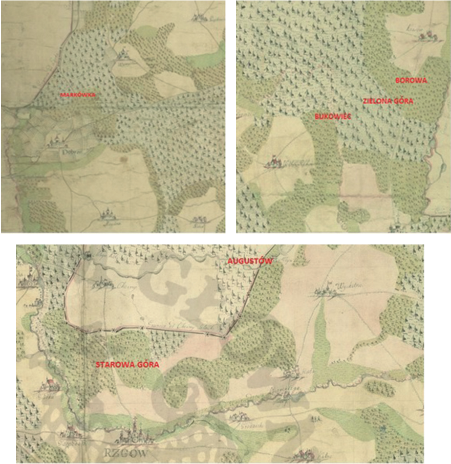
Ryc. 3. Fragmenty Mapy Geometrycznej Hrabstwa Pabianickiego Dziedzicznego Prześwietej Kapituły Katedry Krakowskiej z 1784 r. z uwzględnieniem lokalizacji i nazw późniejszych kolonii fryderycjańskich: A – Markówka, B – Borowej, Bukowca i Zielonej Góry, C – Augustowa i Starowej Góry