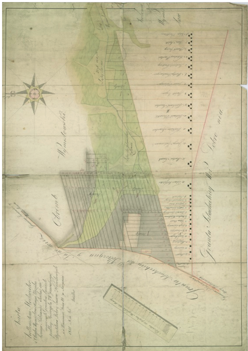
Ryc. 2. Struktura przestrzenna kolonii Markówka z 1811 r. Fig. 2. Spatial structure of the Markówka colony from 1811