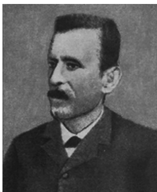
Fig. 1. Władysław Wojciech Zajączkowski (1837–1898)

journals. Several previously published papers were repeated in an expanded version in other languages. Moreover, he published several works on history, popular science, or teaching.