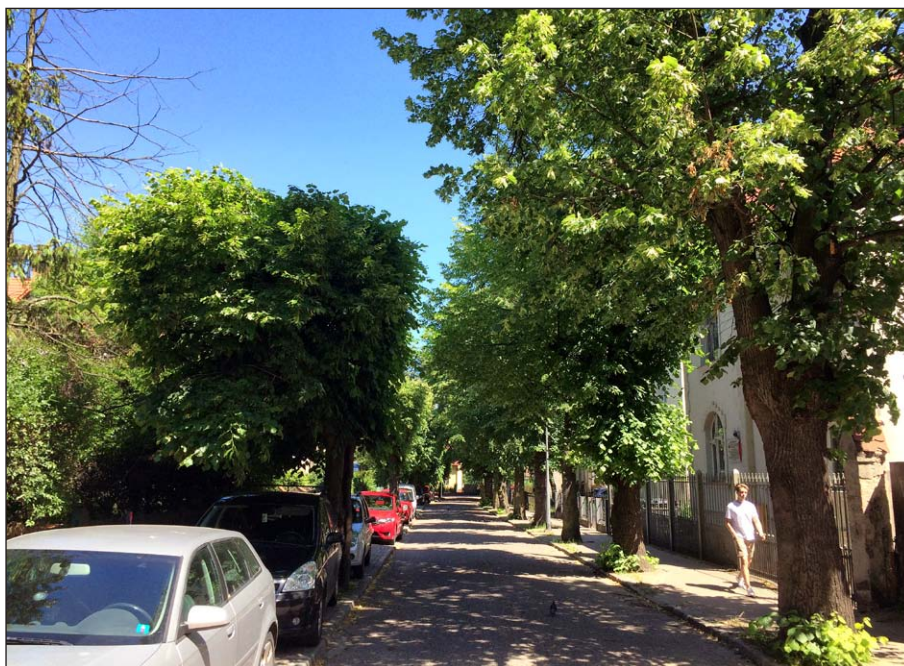
Ryc. 3. Ulica w Gdańsku Oliwie o przebiegu równoleżnikowym. Wysokie drzewa rosnące po południowej stronie drogi zacierają pas drogowy, natomiast rząd niższych drzew od strony północnej nie powoduje nadmiernego zacielenia sąsiednich działek, a uzupełnia kompozycję alei

śnieżną. W przypadku, gdy źródłem oślnienia są promienie słoneczne można zastosować zieleń wysoką. Drzewa dają cień, co wpływa na poprawę bezpieczeństwa w transporcie. Według T. Malczyka (2012), w przypadku dróg o przebiegu równoleżnikowym należy je sadzić po stronie południowej, co przyniesie oczekiwany efekt, a nie spowoduje zacielenia działek leżących po stronie północnej (ryc. 3.). Drogi o przebiegu południkowym powinno się obsadzać drzewami od strony zachodniej, gdyż ruch drogowy w godzinach popołudniowych jest zazwyczaj większy, niż we wczesnych godzinach porannych.