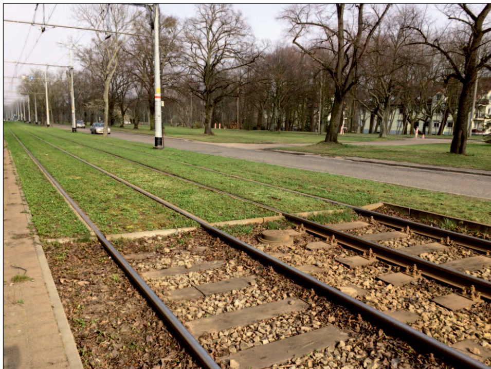
Ryc. 4. Początek odcinka zielonego torowiska tramwajowego, Gdańsk Jelitkowo

Torowiska tramwajowe przebiegają często w korytarzach transportowych wraz z transportem drogowym. Najczęściej są to tereny silnie zurbanizowane, czyli centra miast. Charakteryzują się one dużą koncentracją zjawisk negatywnych pochodzenia transportowego, co jest istotnym argumentem na korzyść zastosowania zielonych torowisk. Dzięki takiemu rozwiązaniu możliwe jest wprowadzenie pasów zieleni w przestrzeni, w której bardzo często nie ma możliwości zagospodarowania dodatkowej przestrzeni na elementy przyrodnicze. Szerokość standardowego pojedynczego pasa toru tramwajowego wynosi 3 metry. Zatem każdy metr długości torowiska daje niemal 3 m 2 powierzchni biologicznie czynnej. Najczęściej tory prowadzone są w obu kierunkach, co podwaja tę wartość. Tym prostym sposobem, można wprowadzić w korytarzu transportowym sześciometrowy pas zieleni, którego głównymi celami są: wzrost powierzchni biologicznie czynnej, mała retencja, ograniczenie zanieczyszczeń, wiązanie pyłów do gleby, ograniczenie hałasu, tłumienie drgań oraz wzrost atrakcyjności miejsca. Zielone torowisko tramwajowe redukuje hałas o 3 dB w porównaniu do standardowego podłoża (Grünleisnetzwerk, 2012). Gdyby Gdańsk zdecydował się zmodernizować choćby połowę tradycyjnych torowisk (uwzględniając torowiska przebiegające w ciągu jezdni, skrzyżowania, przejazdy, przystanki itd.), miasto zyskałoby prawie 170 tys. m 2 terenów biolo-