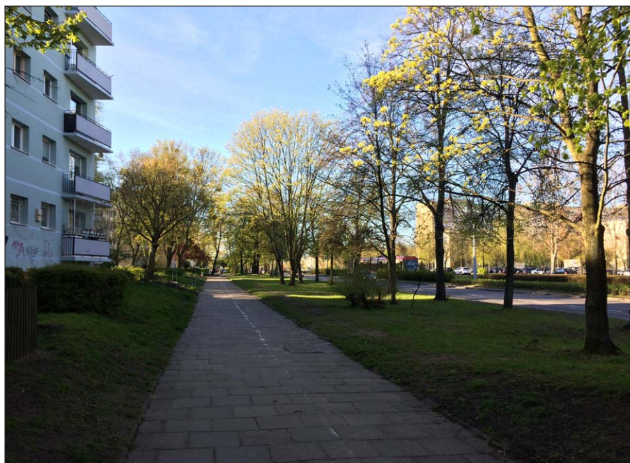
Ryc. 1. Pas zieleni oddzielający drogę dwujezdniową z torowiskiem tramwajowym od zabudowy mieszkaniowej wielorodzinnej, Gdańsk Przymorze Małe

Najefektywniejsze pod względem ograniczania negatywnych zjawisk pochodzenia transportowego są wielopoziomowe pasy zieleni złożone z gatunków o gęstym ulistnieniu. Dzięki zieleni niskiej i wysokiej tworzą zwartą barierę, która oprócz poprawy jakości powietrza pod względem chemicznym i fizycznym, skutecznie redukuje poziom hałasu. Wymaga to jednakże znacznie większej powierzchni terenu, niż w przypadku zastosowania tradycyjnych ekranów dźwiękochłonnych (ryc. 1). Przyjmuje się, że pas zieleni o szerokości 1 m redukuje poziom hałasu o 0,2–0,4 dB, a żeby zmniejszyć natężenie dźwięku o 10 dB powinno się zastosować pas zieleni o szerokości 15 m i wysokości 5 m (Łukasiewicz, Łukasiewicz, 2011). Należy mieć jednak na uwadze, że szerokie pasy zieleni pomimo wysokiej efektywności akustycznej