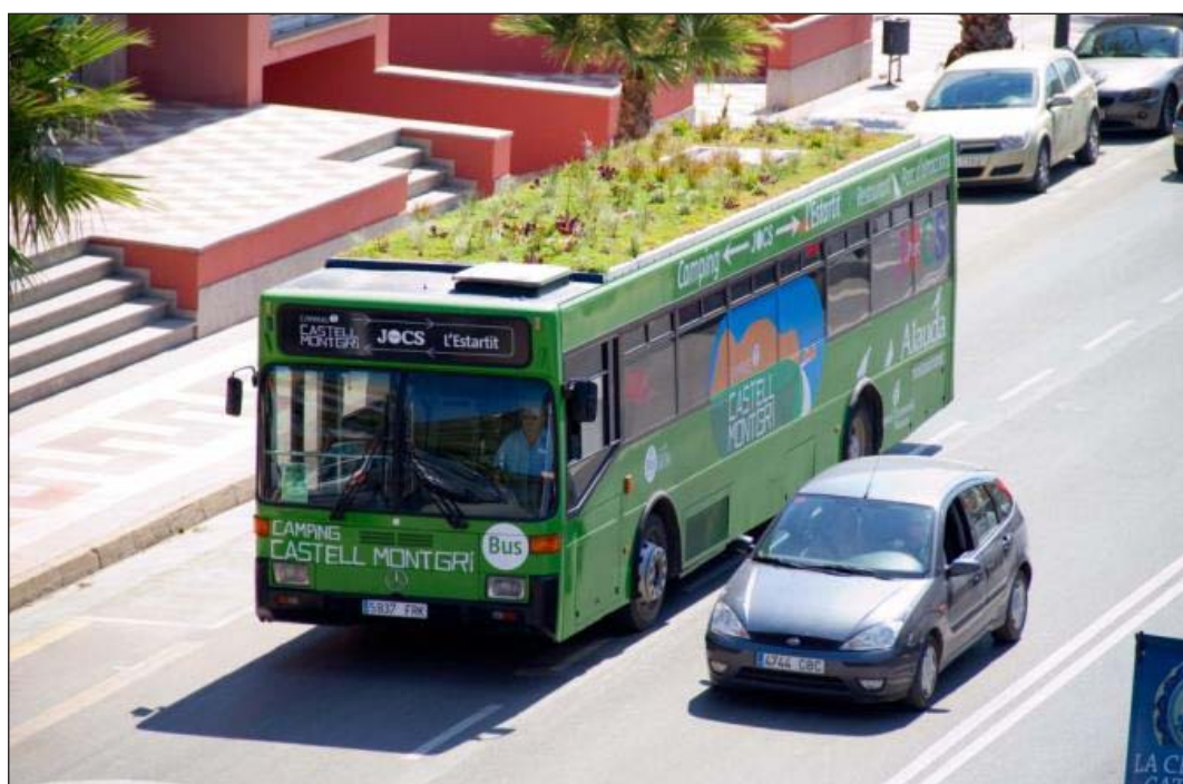
Ryc. 5. Autobus z zielonym dachem, Hiszpania

Projekt zielonych dachów montowanych na dachach pojazdów został wprowadzony przez hiszpańskiego architekta krajobrazu. Taka instalacja może zostać zamontowana zarówno na samochodach osobowych i ciężarowych, jak również na autobusach. Realizacja pierwszych projektów miała miejsce jednak na dachach autobusów turystycznych w Gironie (ryc. 5.). Instalacja nie wymaga nowych i specjalnie przystosowanych do tego pojazdów. Dach montowany może być na funkcjonujących już w komunikacji miejskiej autobusach. Instalacja takiego dachu polega na: zamontowaniu ramy zewnętrznej oraz ażurowych przegród wewnątrz ramy, uszczelnieniu powierzchni, wyłożeniu warstwy substratu glebowego, rozścieleniu trawy, zainstalowaniu systemu nawadniającego, przykryciu całości siatką zabezpieczającą przed uszkodzeniem podczas jazdy oraz dodatkowym nasadzeniem roślin ozdobnych. Zielony dach nawadniany jest przede wszystkim wodą pochodzącą z systemu klimatyzacji. W przypadku zastosowania instalacji standardowych autobus wyposażony jest w około 20 m 2 zielonego dachu, który przemieszcza się w korytarzach transportowych. To dodatkowa powierzchnia biologicznie czynna, która