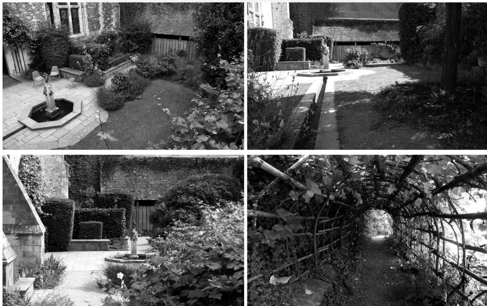
III. 1. Queen Eleanor's Garden in Winchester

The method of re-creating historic gardens presented in the article creates new opportunities for exhibiting cultural heritage to the wider population. It enables visitors to learn more about history and its impact on modern times. Gardens are not stagnant museum spaces, but spaces in which, as in the Middle Ages, life goes on.