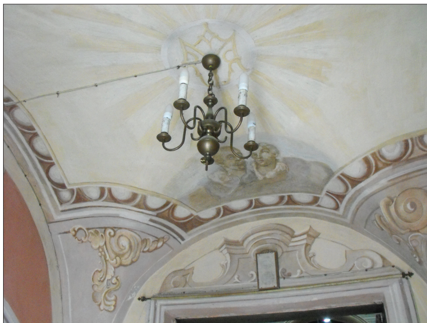
Ilustracja 2. Klesztów, dawna cerkiew Wniebowzięcia NMP, sklepienie kruchty, freski Gabriela Sławińskiego, sygnowane 1772, fot. M. Ludera