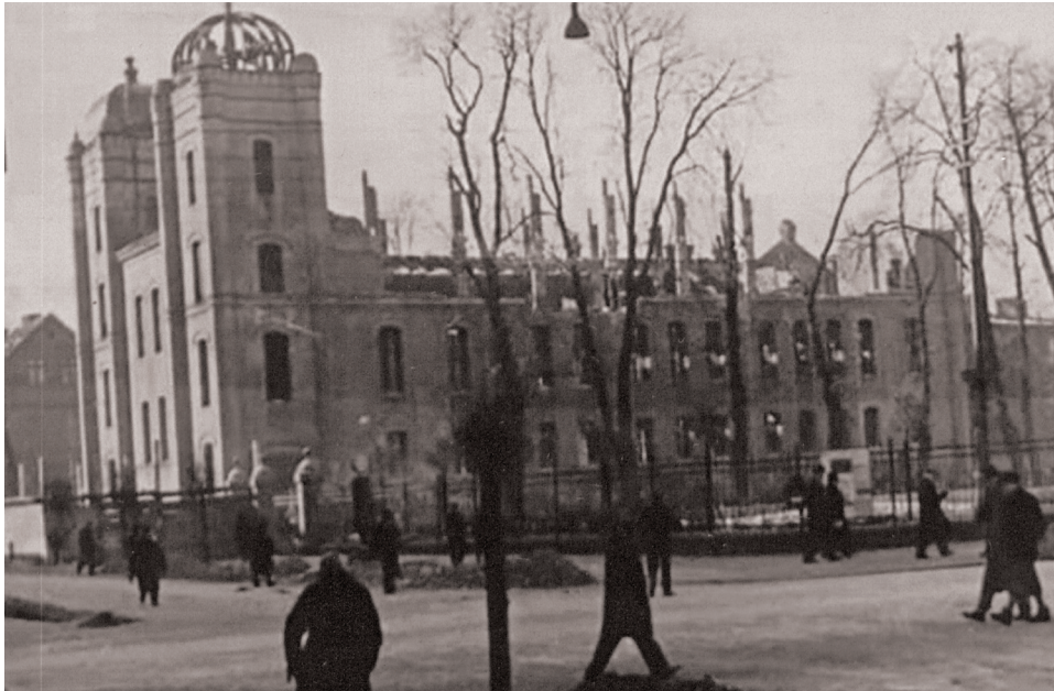
Fot. 6. Rozbiórka synagogi w Gnieźnie. Przełom lat 1939/1940

przez Polskę niepodległości w sposób drastyczny. Zachowała się jednak znacząca infrastruktura, będąca owocem działalności liczącej się liczebnie społeczności żydowskiej w okresie pruskim. Garstka wyznawców, jaka pozostała na miejscu, nie była jej w stanie utrzymać. Problemy finansowe powtarzają się w sprawozdaniach obejmujących tę tematykę bardzo często. Wyraźnie jest też widoczne bardzo oszczędne gospodarowanie niewielkimi środkami finansowymi. Brak wyznawców i związana z tym sytuacja materialna powodowały konieczność wyprzedaży niektórych składników majątku. Kres miejscowej społeczności żydowskiej położyła II wojna światowa i okupacja niemiecka. Informacje na temat ostatnich dni społeczności żydowskiej w powiecie gnieźnieńskim zachowały się w znikomej ilości. Wysiedlenie z Witkowa nastąpiło 14 grudnia 1939 r. Do tego czasu w mieście przebywały cztery osoby wyznania mojżeszowego. Jedna z nich zmarła w dniu wysiedlenia (okoliczności nie podano). Wywieziono trzy osoby.