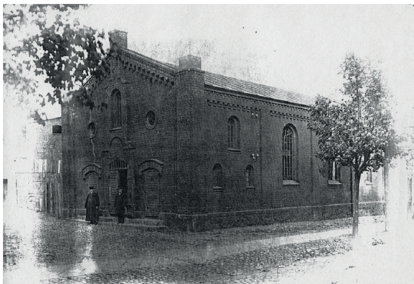
Fot. 2. Synagoga w Janowcu Wielkopolskim

Ich łączną wartość oszacowano na 240 zł. Druga część nieruchomości znajdowała się w Janowcu. Były to cztery korony do Tory, dwie tablice z dziesięcioma przykazaniami, dwie puszkę korzeniowe, dwie wskazówki do Tory, jeden kielich, siedem rodalów, jedna megilla, pięć zasłon, sześć nakryć ołtarzowych, dwa dywany, jeden zegar, jedna portiera, trzy duże i dwa małe chodniki, dwa duże i jeden mały lichtarz pięcioramienny, dodatkowo jeden lichtarz chanukowy i trzy inne, dwa szare i jeden biały płaszcz do Tory, osiem słupów do baldachimu, jedno pokrycie do baldachimu, sześć szofarów i jeden karawan. Ich łączna wartość wynosiła 1887 zł, z czego jedynie siedem rodalów wyceniono na 800 zł, wartość pozostałych przedmiotów ustalono od 5 zł (biały płaszcz do Tory i lichtarz na święto Chanuki) do 150 zł (karawan) 24 .