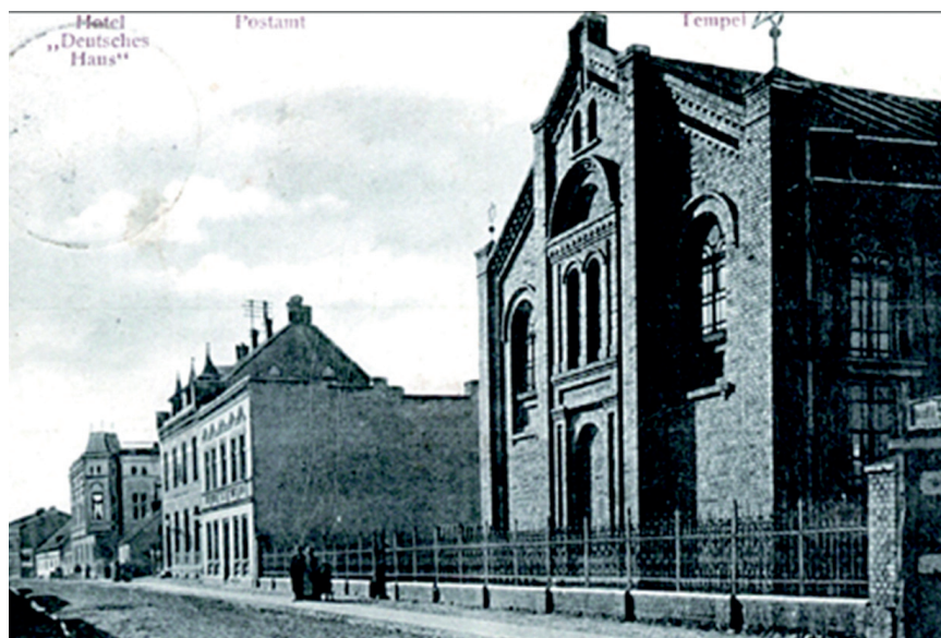
Fot. 5. Synagoga w Żninie przed 1918 r.

fizycznego (np. boisko do gier sportowych, a kostnicę na szatnię). W dwuizbowym domku przy cmentarzu obok probostwa chciano urządzić mieszkanie dla stróża żnińskich kirkutów, a domy przy ul. Pocztowej planowano przekazać na cele Opieki Społecznej (dom starców, sierociniec itp.) 54 .