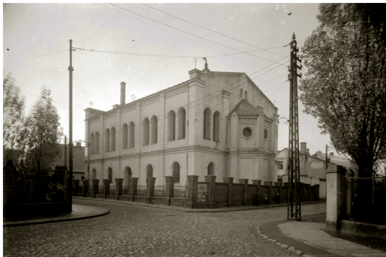
Fot. 4. Synagoga we Wrześni w okresie międzywojennym

Gmina Żydowska we Wrześni, podobnie jak gmina gnieźnieńska, posiadała bogate archiwum. Najwięcej dokumentów dotyczyło spraw administrowania fundacjami (legatami), angażowania urzędników, kwestii związanych z synagogą oraz długów gminy. Łącznie cały zasób aktowy składał się z 213 tomów akt 39 .