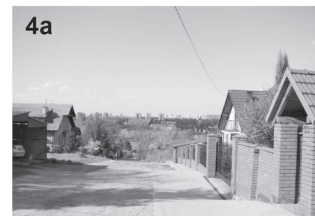
il. 4. Drogi prywatne (4a – 4d) – „sięgacze”, na przykładzie zabudowy między ulicami Wyżynną i Miarową ill. 4. „Private roads” (4a – 4d) – buildings between Wyżynna and Miarowa streets

The houses had flat roof or a roof with a slight slope. Unfortunately, flat roofs often leaked. For this reason, most of them have been rebuilt into gable roofs or