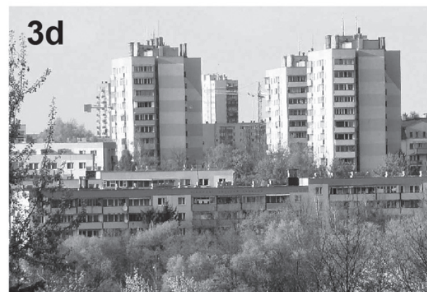
il. 3. Formy budynków mieszkalnych: 3a – dom z początku XX wieku; 3b – dom z połowy XX wieku; 3c – dom z lat 80.; 3d – osiedle Kurdwanów Nowy ill. 3. Forms of residential buildings: 3a – house from the beginning of the 20th century; 3b – house from the middle of the 20th century; 3c – house from the 1980s; 3d – estate of Kurdwanów Nowy

Nowe domy wznoszone w I poł. XX wieku naśladowały dawne formy. Obiekty zachowały prostokątny kształt i dwuspadowe przekrycie (il. 3b). Stosowano dwa typy ścian zewnętrznych: drewniane z oblicówką lub ceglane wykończone tynkiem. Budynki były nieznacznie większe od swoich poprzedników. Częstym zabiegiem było dodatkowe wydłużanie rzutu lub podwyższenie ścian poddasza co pozwalało uzyskać dodatkową przestrzeń użytkową. Popularne stały się ganki wejściowe do domów oraz niewielki okap rozdzielający ścianę parteru od pola szczytowego. Coraz częściej budynki mieszkalne były podpiwniczone. Charakter zabudowy różnił się tylko nieznacznie od tego z poprzednich dekad.