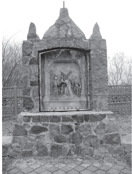
Jedna ze stacji Drogi Krzyżowej na cmentarzu w Kokaninie