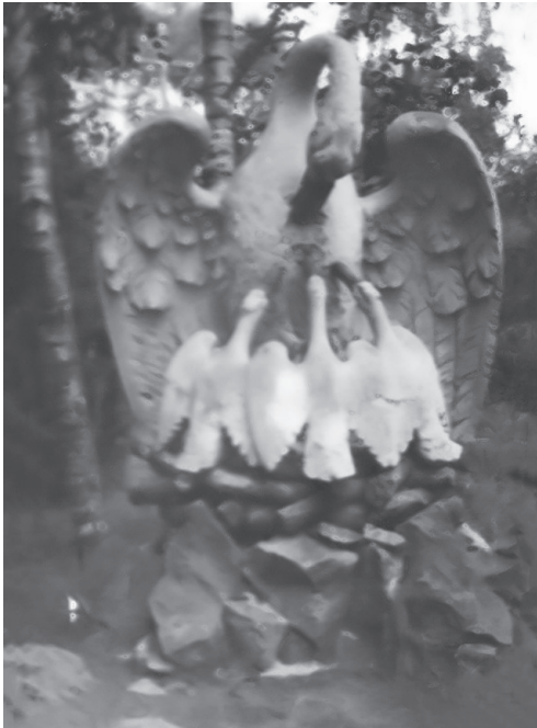
Rzeźba pelikana karmiącego młode