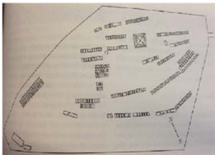
Il. 6. Plan cmentarza numer 185 w Lichwinie. „Maszerujący oddział” znajduje się po lewej stronie cmentarza, usytuowany równolegle względem północnej krawędzi nekropolii.

dokładny, że bitwę performować, to jest wystawiać, można ze szczegółami. Dlatego też kwatery cmentarne są nieregularne, oddając przebieg bitwy. Zwłaszcza zaś jedna z nich, zwana w literaturze „maszerującym oddziałem” 41 , zdaje się drobiazgowo opisywać jeden z jej epizodów (il. 6).