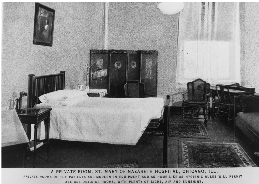
Fot. 2. Poczтівka przedstawiająca luksusową salę chorych w Szpitalu Nazaretanek w Chicago, 1925 r.

rych, laboratoria analityczne, jadalnie, apteka, gabinet rentgenowski, kuchnie, pralnie. Pacjenci mieli do dyspozycji zarówno sale wieloosobowe, jak i prywatne pokoje jednoosobowe o wysokim standardzie. Każda kondygnacja zaopatrzona była w obszerne tarasy służące do relaksu i kąpieli słonecznych. Budynek szpitala otaczał duży ogród przeznaczony zarówno dla pacjentów, jak i ich rodzin oraz pracowników szpitala. Przyjmowano wszystkich potrzebujących, z wyjątkiem osób chorych na gruźlicę i inne choroby zakaźne 13 . Szpital cieszył się dużym obłożeniem. W 1921 r. udzielono pomocy ponad 4900 pacjentom, z czego prawie 80% było pochodzenia polskiego. Oprócz funkcji klinicznej szpital był też centrum dydaktycznym. W 1900 r. przy szpitalu powołano Szkołę dla Pielęgniarek 14 . Podczas II wojny światowej poszerzono kształcenie, organizując Szkołę dla Techników Radiologii, a następnie w 1947 r. Szkołę Technik Medycznych.