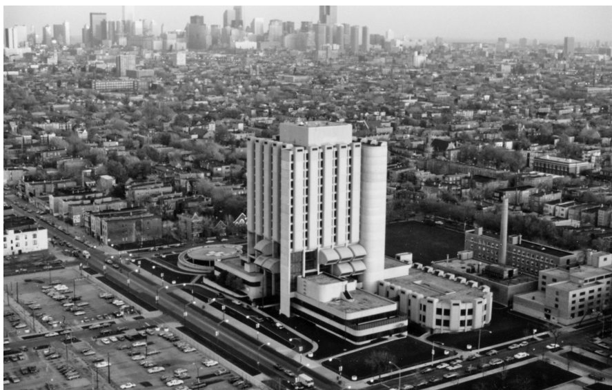
Fot. 3. Współczesny budynek szpitala Nazaretanek w Chicago, 1990 r., w zbiorach Zgromadzenia Sióstr Św. Rodziny z Nazaretu, Des Plaines, USA

Rozwijający się szpital po latach znów okazał się zbyt mały, aby sprostać zapotrzebowaniu ze strony środowiska polskiego. W latach 70. XX w. podjęto bardzo ważną i rewolucyjną decyzję o zburzeniu starego gmachu szpitala i budowie nowego. W miejscu dotychczasowego szpitala za 43 mln dolarów zbudowano nową placówkę, mieszczącą 490 łóżek na 16 piętrach 15 . Główną promotorką budowy oraz organizatorką leczenia była siostra Stella Louise Słomka – dziś 98-letnia nazaretanka, której rodzice przybyli do Chicago z okolic Krakowa. Nowoczesny szpital oficjalnie otwarto w 1975 r. 16 Kompleks szpitalny Świętej Marii z Nazaretu od początku stanowił swoiste centrum polskiej medycyny klinicznej w Chicago, w którym pomoc znajdowali przede wszystkim polscy pacjenci, ale także polscy lekarze. Większość z przybywających do Chicago medyków swój pierwszy staż bądź rezydenturę na amerykańskiej ziemi odbywała właśnie u nazaretanek. Dziś w pierwszym polskim szpitalu w Chicago nie pracują już polscy lekarze, na skutek przemian etnicznych w okolicznych dzielnicach zmienili się również pacjenci. Zazwyczaj są to Meksykanie, Hindusi, natomiast trudno spotkać tu Polaków.