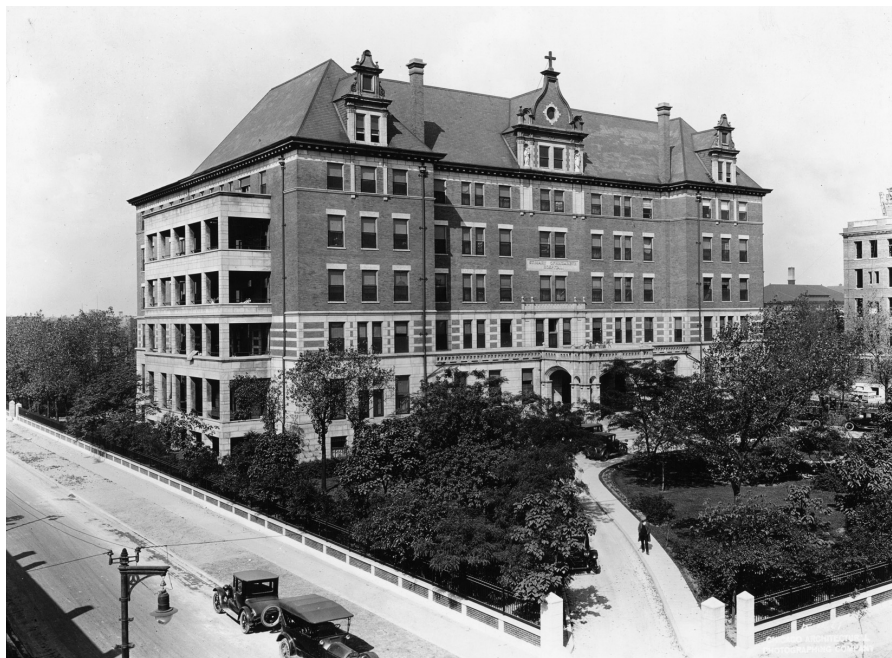
Fot. 1. Gmach drugiego Szpitala Nazaretanek w Chicago, 1925 r., w zbiorach Zgromadzenia Sióstr Św. Rodziny z Nazaretu, Des Plaines, USA