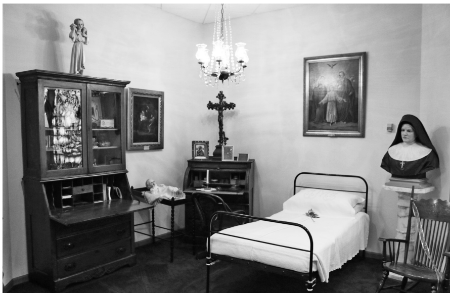
Fot. 9. Sala poświęcona założycielce zakonu nazaretanek – bł. Siostrze Franciszce Siedliskiej. Dom główny Zgromadzenia, Des Plaines, USA.

nie wie gdzie. Należy mieć świadomość, że przy braku personelu, który posługuje się językiem polskim, dokumenty archiwalne polskiego szpitala mogą zostać uznane za niepotrzebne, mało ważne i ostatecznie wyrzucone.