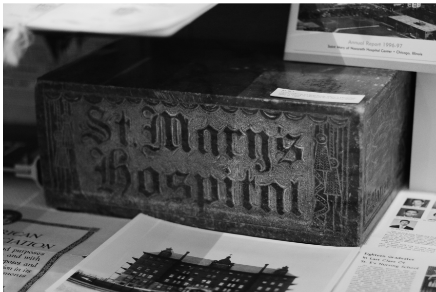
Fot. 8. Kamień węgielny z gmachu szpitala Nazaretanek w Chicago, 1902 r., w zbiorach Muzeum Szpitala św. Marii z Nazaretu.