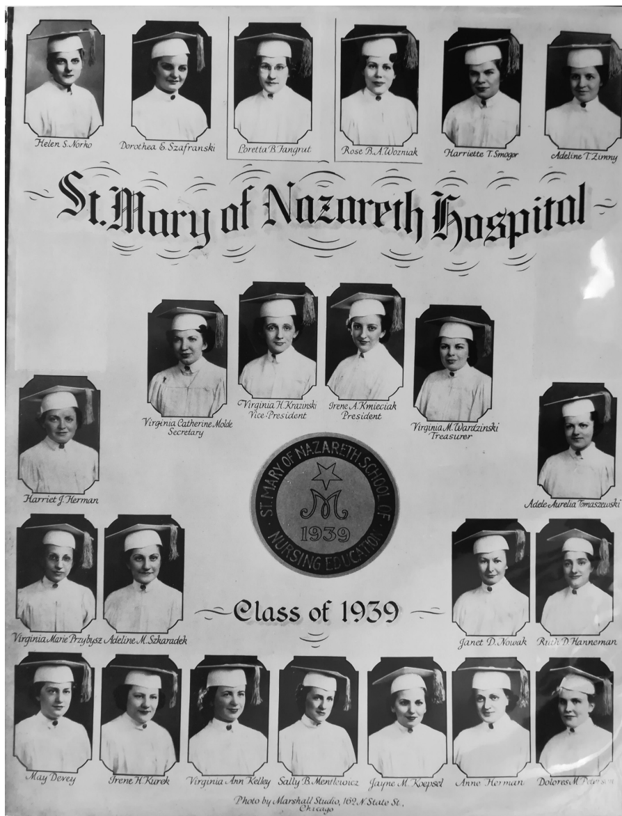
Fot. 7. Album absolwentek Szkoły Pielęgniarskiej z 1939 r., ze zbiorów Muzeum Szpitala Św. Marii z Nazaretu w Chicago.