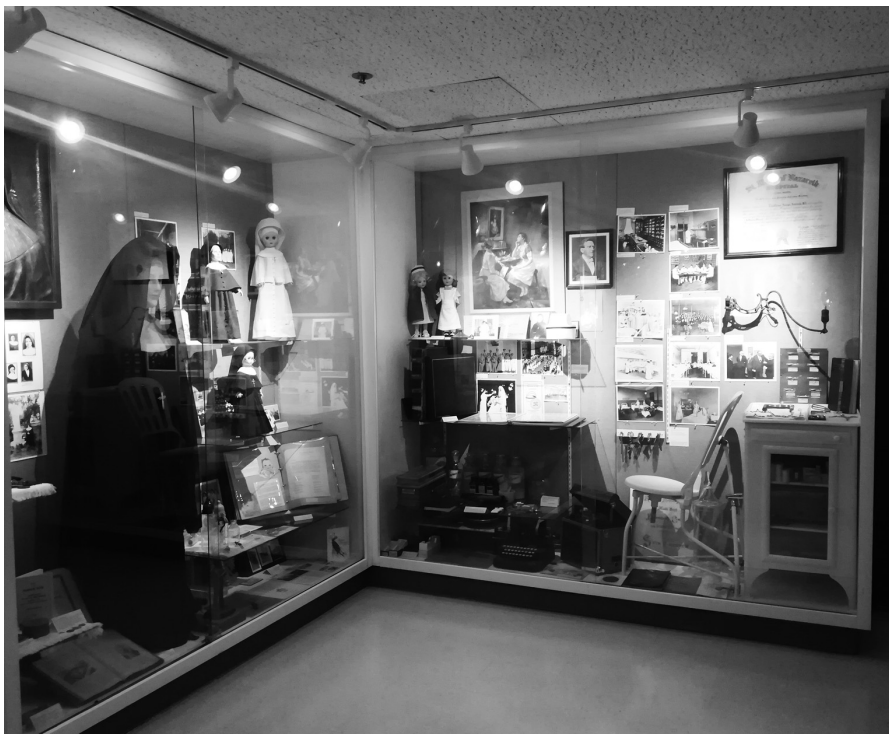
Fot. 5. Muzeum w gmachu głównym szpitala Nazaretanek w Chicago, 2018 r.