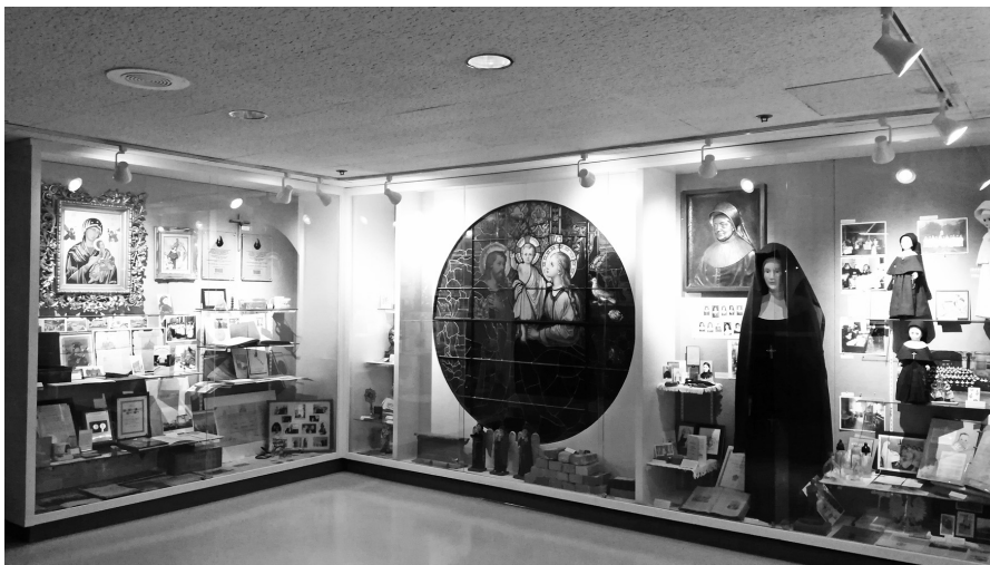
Fot. 4. Muzeum w gmachu głównym szpitala Nazaretanek w Chicago, 2018 r.