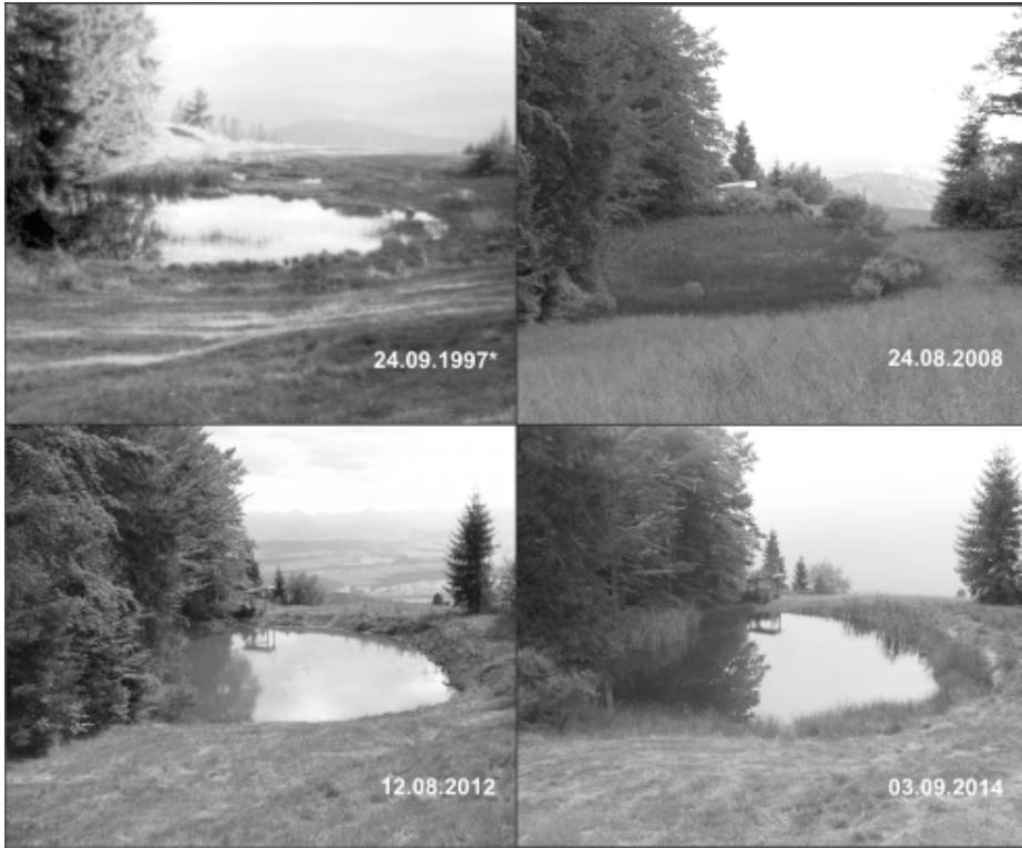
Ryc. 3. Zmiany powierzchni Pucółowskiego Stawku w latach 1997–2014