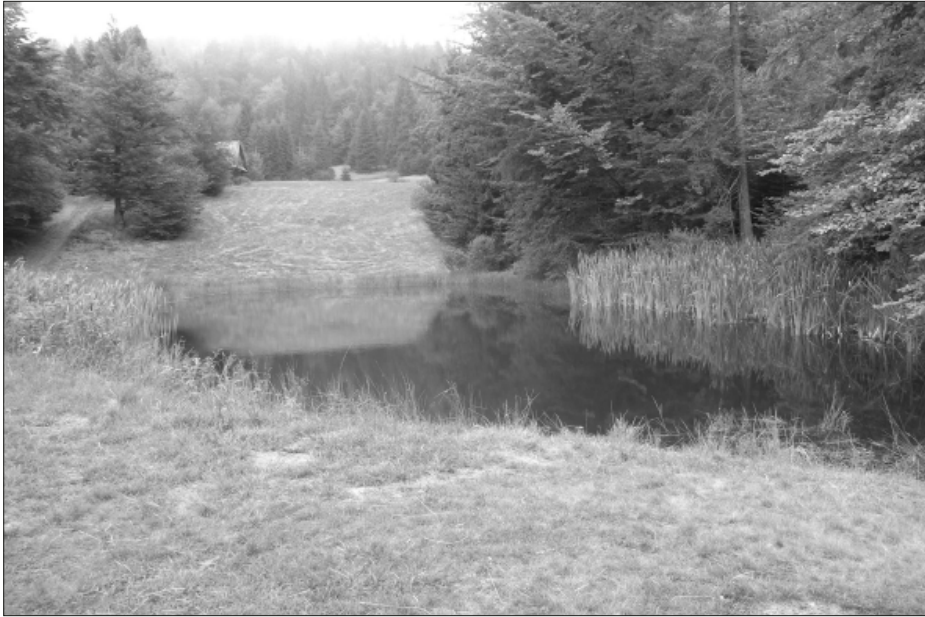
Fot. 2. Dynamiczna sukcesja pałki szerokolistnej w obrębie zachodniego i wschodniego brzegu Pucółowskiego Stawku

Photo 2. Dynamic succession of the Typha latifolia L. on the western and eastern shores of Pucółowski Stawek lake