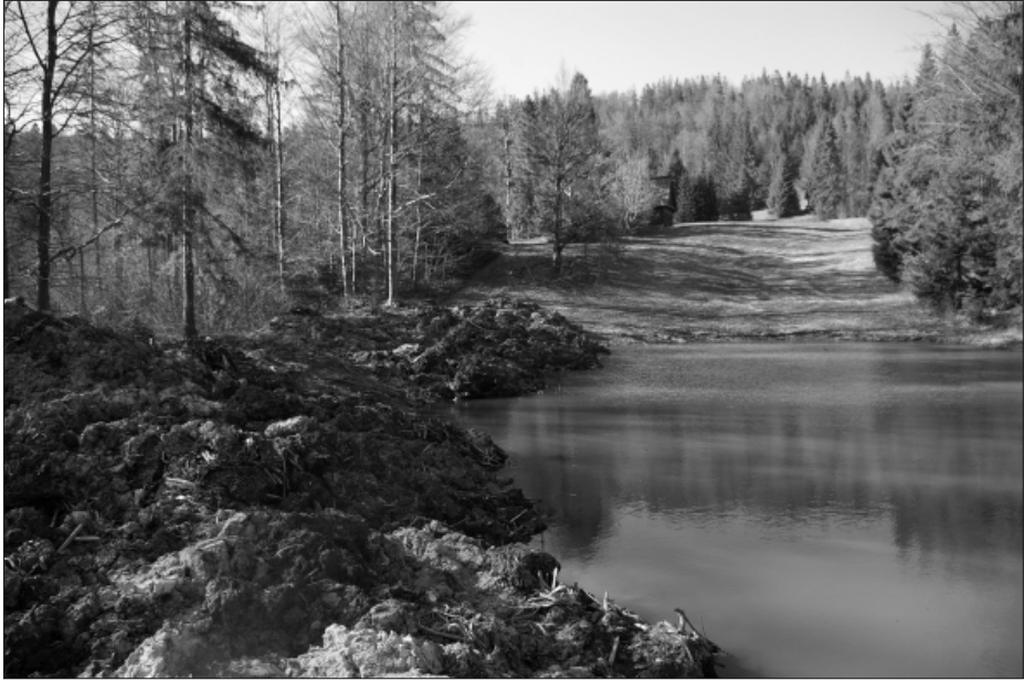
Fot. 1. Pogłębiona misa Pucółowskiego Stawku wraz ze złożonymi na jej brzegu osadami

Photo 1. Deepened basin of Pucółowski Stawek lake with sediments removed